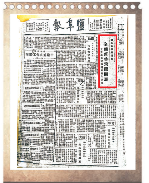
1942年4月6日《盐阜报》整版报道盐阜区群众运动全面蓬勃飞跃开展。

硝烟虽已散去,新四军的号角声犹在耳畔,催人奋进。新征程上,习近平总书记在盐城考察时的重要指示精神正激励着广大党员干部始终把“人民”二字深深植于心,进一步树牢造福人民的政绩观,大力弘扬不怕困难、不畏艰险、勇于斗争、敢于胜利的精神,永远和人民一道奋斗,永远和人民一起前进,凝聚起推进中国式现代化盐城新实践的强大合力。