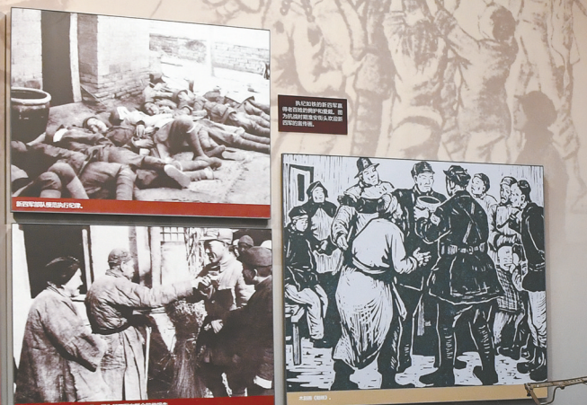
新四军纪念馆场景图