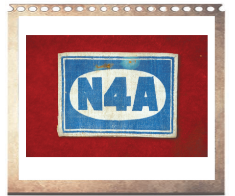
图为新四军佩戴时间最长的一款“N4A”臂章。“N4A”是英文“new fourth army”的缩写,由新四军内文化名人、华中鲁艺美术系教授庄五洲、许幸之设计。

盐阜大地,红色资源星罗棋布,全市有128处烈士名字命名的镇村,248处红色遗址,1.8万余名革命烈士长眠于此。