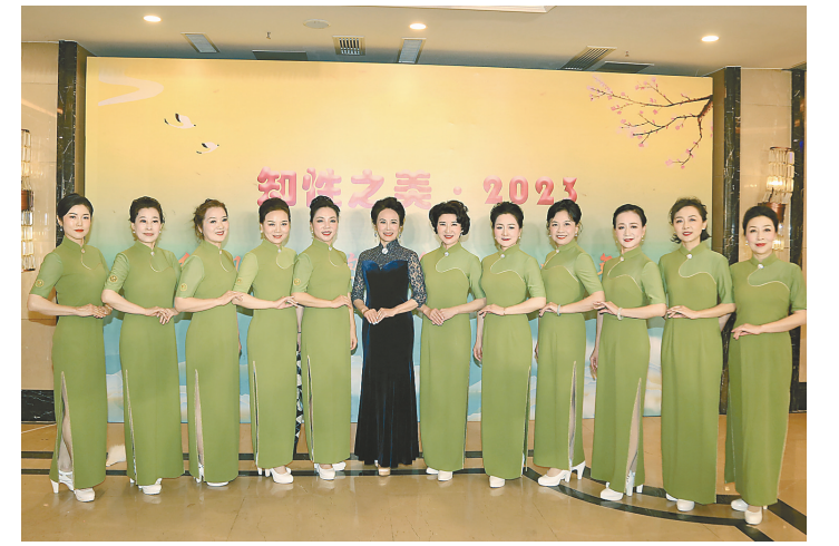
活动现场