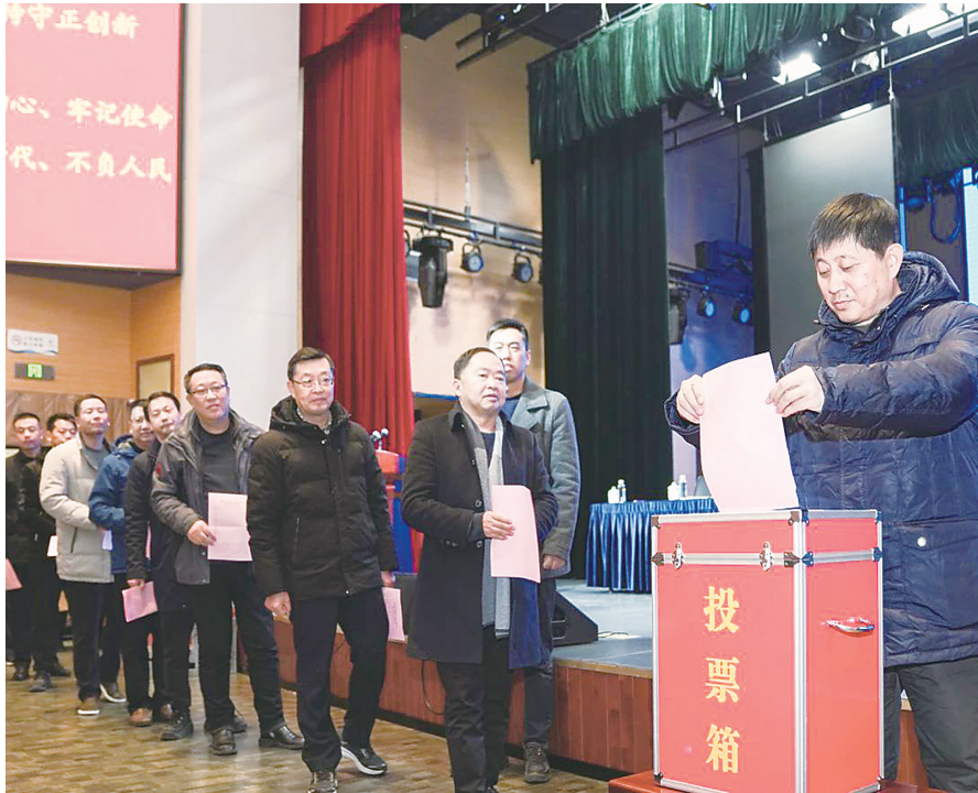
会议现场

理事名单:于海琴、万载元、马兆余、王汉刚、王刘华、王润松、王新鑫、卢高、吕亚楼、朱从东、乔磊、仰传作、刘长云、刘必龙、刘金涛、刘潇春、江从武、孙华之、孙苏奎、孙环勇、杜翔、李成城、李超、李耀中、束伟峰、还璇瑜、吴云、吴洪春、吴健华、何开炼、沈洪军、宋子扬、宋益凡、张德祥、张蕾、陆晓雨、陈长飞、陈玉洋、陈明华、陈剑波、陈剑峰、陈桂庚、陈宽、邵定国、范国仁、范明旭、周文品、周荣庭、郑尧春、郑喆、胡可、胡荣东、柳灿红、施江、顾正元、顾冬成、顾守山、顾晓燕、殷作为、高中明、高林、唐晓斌、曹万峰、曹福章、葛金淮、蒋福伟、韩永健、惠开永、嵇加龙、嵇绍玉、薛媛、戴文彬。