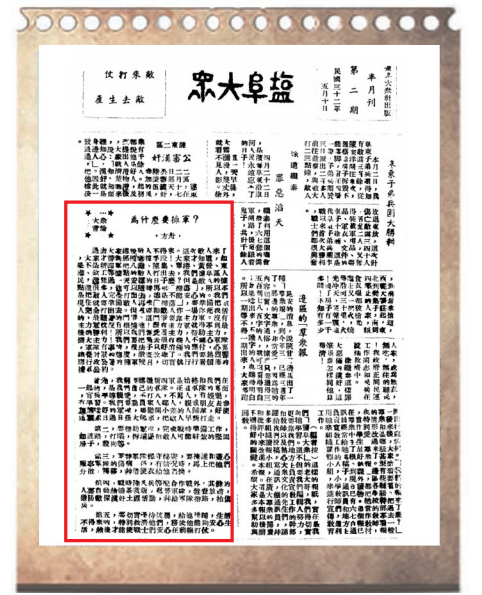
反映新四军与盐阜人民生死与共、鱼水情深的稿件《为什么要拥军？》(1943年5月10日《盐阜大众》报)。