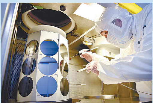
鹿泉区普兴电子车间,技术员进行硅晶片检测。