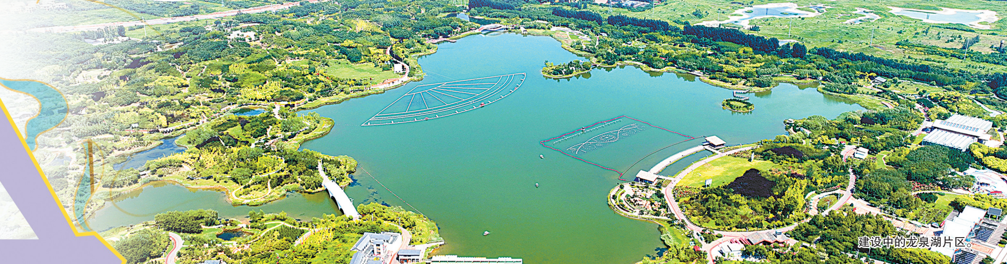
建设中的龙泉湖片区。