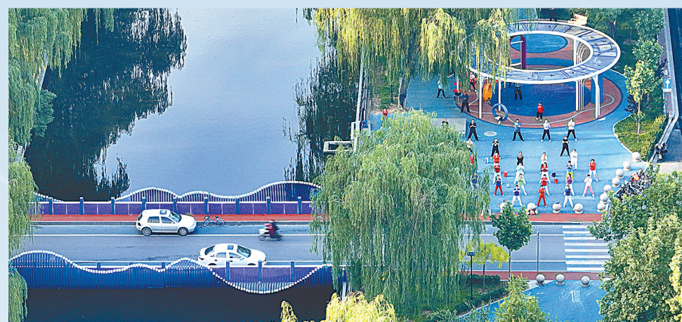
市民在民心河步道上晨练。