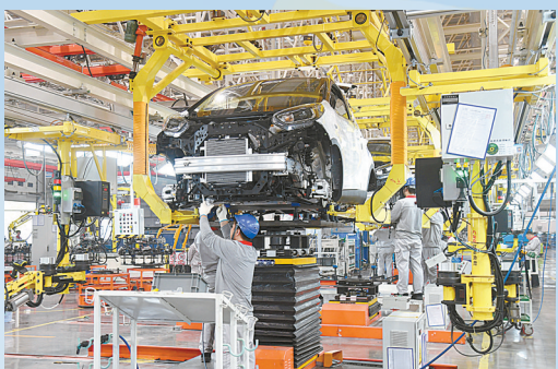
在奇瑞新能源石家庄分公司生产车间,工作人员正在组装电动汽车。