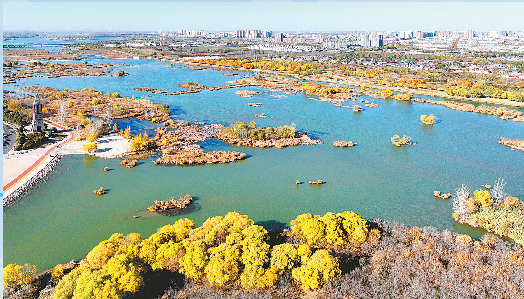
冬日滹沱河美景如画。