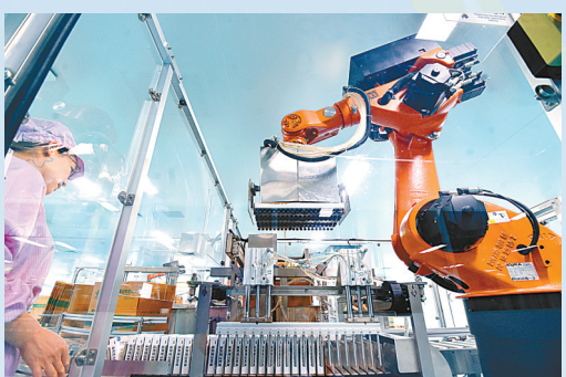
神威药业自动化药品生产线。