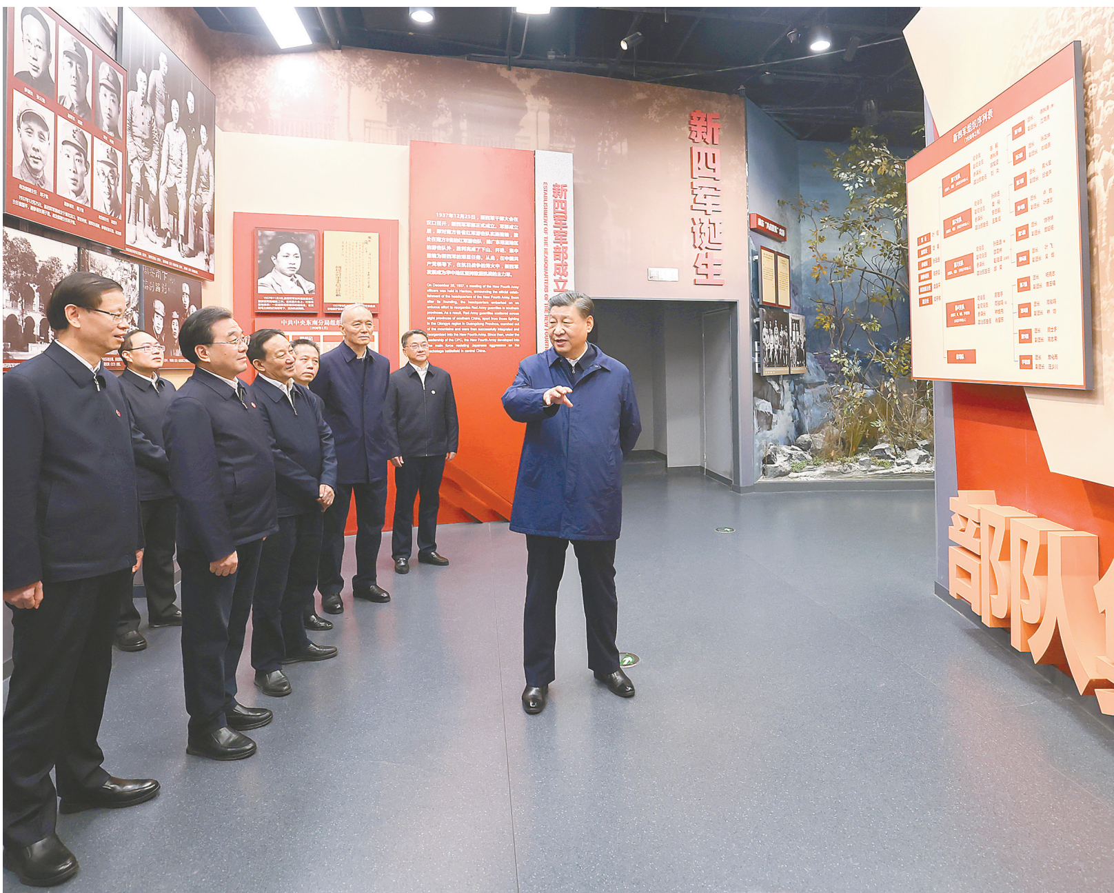
12月3日，中共中央总书记、国家主席、中央军委主席习近平在上海考察结束返京途中，来到江苏省盐城市参观新四军纪念馆。