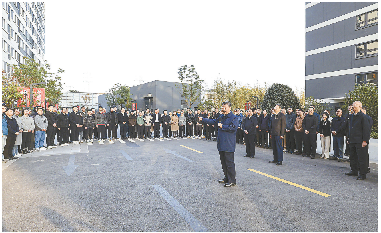
11月28日至12月2日,中共中央总书记、国家主席、中央军委主席习近平在上海考察。这是11月29日下午,习近平在闵行区新时代城市建设者管理者之家,同社区居民亲切交流。

新华社上海/江苏盐城12月3日电 中共中央总书记、国家主席、中央军委主席习近平近日在上海考察时强调,上海要完整、准确、全面贯彻新发展理念,围绕推动高质量发展、构建新发展格局,聚焦建设国际经济中心、金融中心、贸易中心、航运中心、科技创新中心的重要使命,以科技创新为引领,以改革开放为动力,以国家重大战略为牵引,以城市治理现代化为保障,勇于开拓、积极作为,加快建成具有世界影响力的社会主义现代化国际大都市,在推进中国式现代化中充分发挥龙头带动和示范引领作用。