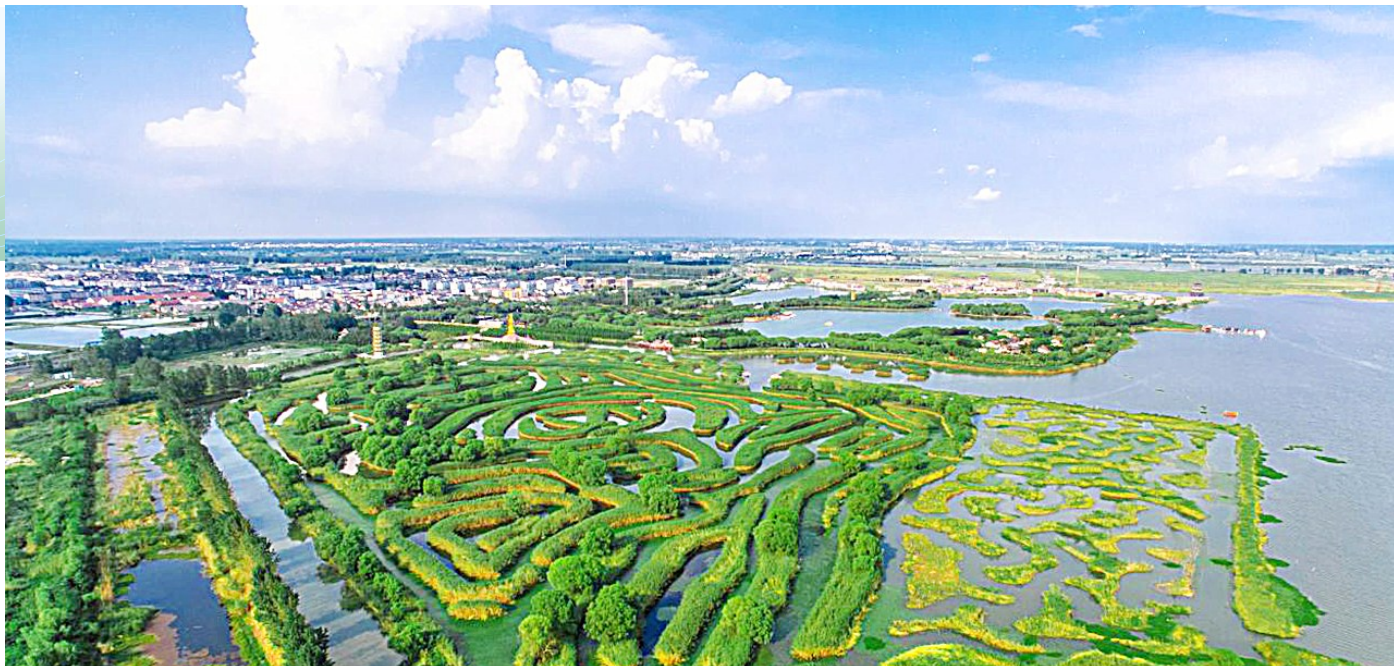
该行于2021年12月开始向大纵湖风景区陆续投放1.5亿元项目贷款,用于景区自然景观改造和文化内涵提升。

党的二十大报告提出,“推动经济社会发展绿色化、低碳化是实现高质量发展的关键环节”。绿色,已成为高质量发展最鲜明的底色。近年来,盐城深入践行新发展理念,抢抓“双碳”机遇,以建设绿色低碳发展示范区为破题之钥,推动生产绿色转型、加快能源绿色赋能,厚植生态绿色本底,探索绿色低碳发展之路。