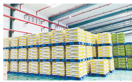
支持特色农业产业发展

盐城欣丰利农业科技开发有限公司是一家从事农业生产技术开发、推广、应用;水产品养殖、销售;渔业技术服务;农作物种植;农产品购销;园林绿化工程施工;林木、花卉、草坪种植、销售;园林绿化养护等领域的公司。今年,光大银行盐城分行积