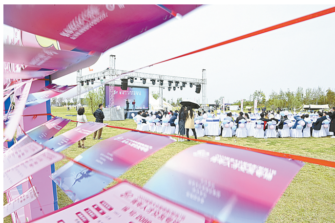
4月29日至30日,在中华海棠园举办的青年人才交友活动

据悉,“盐城报业万人牵手”会员经审核将进入活动群,确保群内成员均为真实可信、诚意交友的单身人士。线下活动产生的食、宿、交通成本均由个人承担,具体费用将在活动前通知。活动热线:15961980601、13814380212。