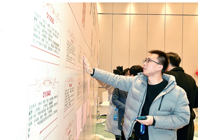
今年元宵节,在大洋湾希尔顿逸林酒店举办的青年人才交友活动