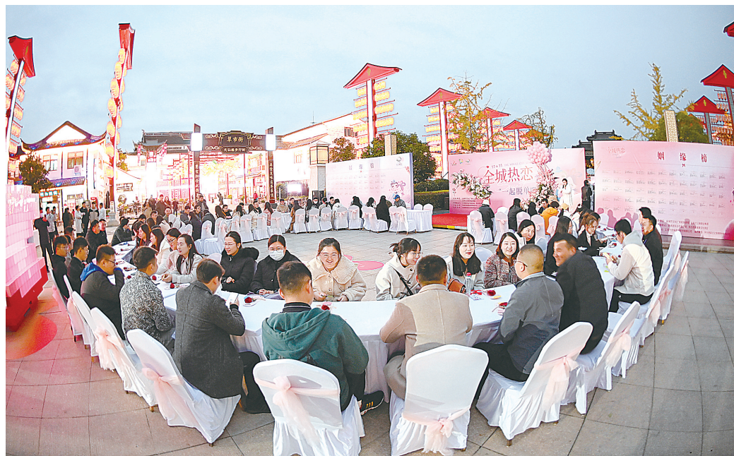
11月11日,在东台西溪景区举办“一起脱单吧”活动

活动组委会负责人表示,“盐城报业万人牵手”活动将在延续以往活动特色的基础上,再度