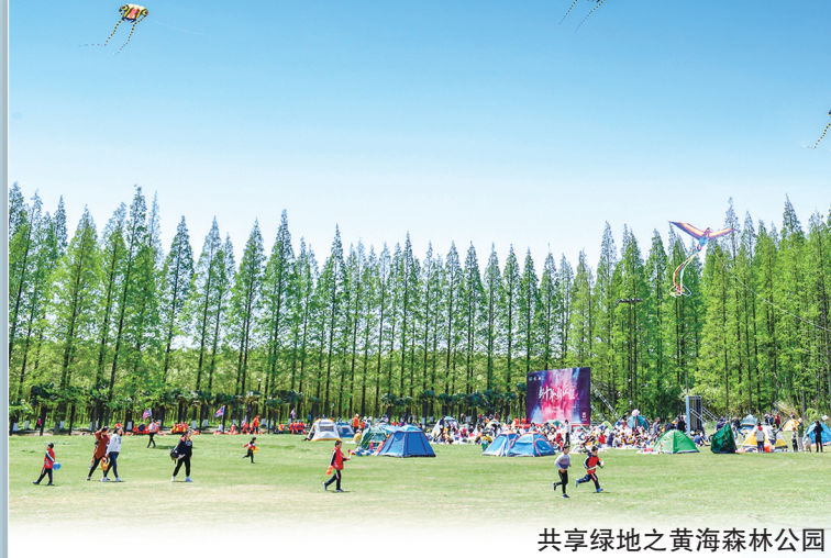
共享绿地之黄海森林公园