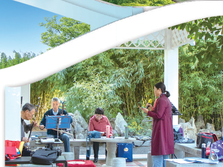
“乐享园林”之迎宾公园