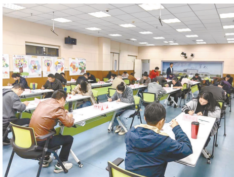
学员们认真听讲,积极参与互动。

学员们纷纷表示,通过本次培训,创新创业教育理念得到进一步升华,教育能力得到进一步提升。今后将进一步练就培训“硬本领”,当好创业“指路人”,切实肩负起创新创业人才培养的重任,在后续创业培训的教学中持续深耕细作,将创业知识和最新的创业理念层层传导给创业者。