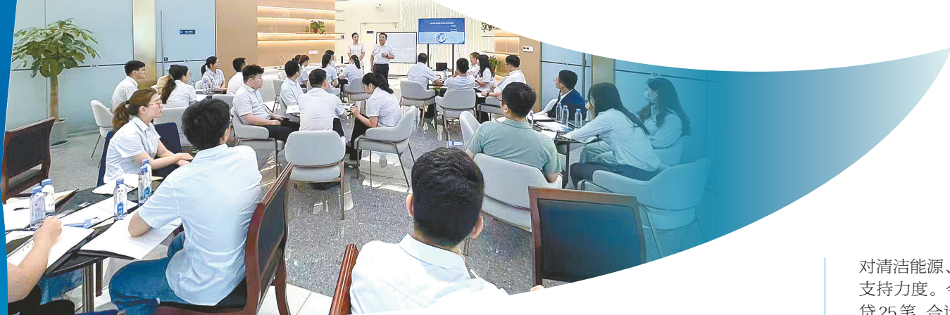
组织开展客户经理培训,讲解绿色金融政策相关知识