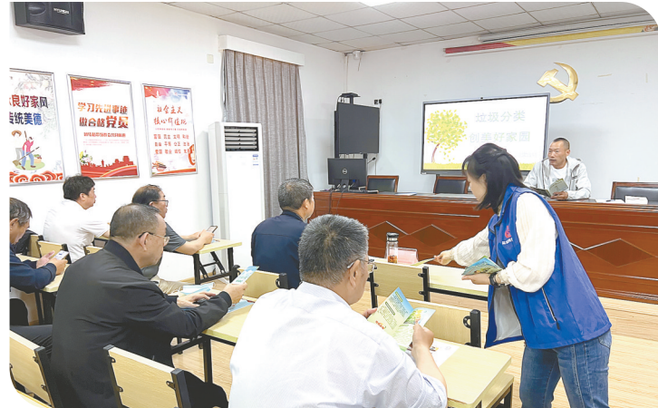
联合五星街道城东社区,为老年人普及绿色发展理念