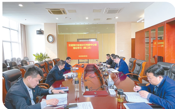
召开党委中心组理论学习,研讨绿色金融课题