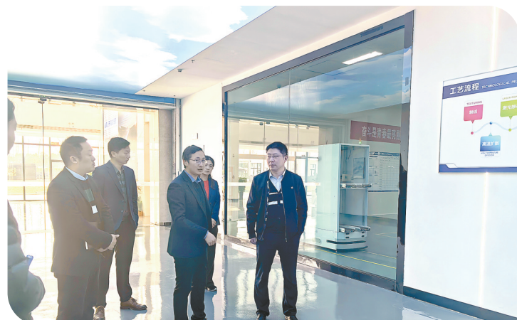
实地走访企业,了解企业情况及融资需求