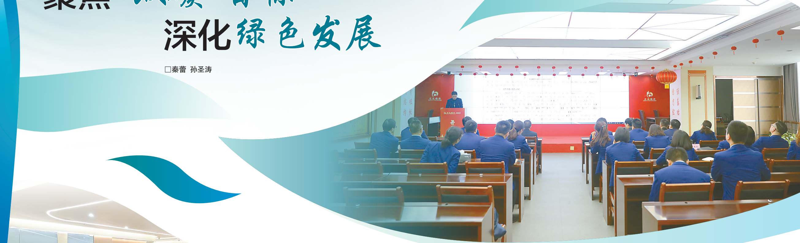
宣讲绿色金融政策