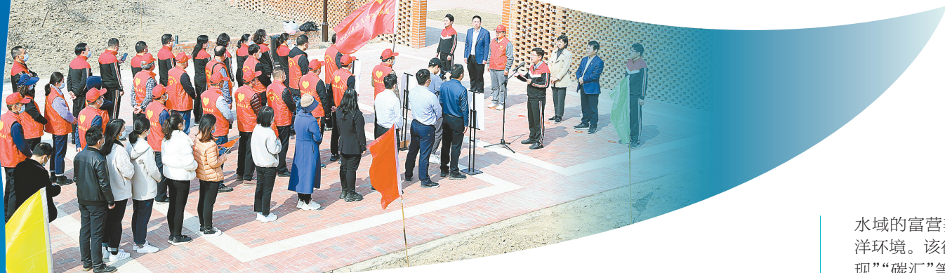
开展“绿筑美丽华夏”植树节活动