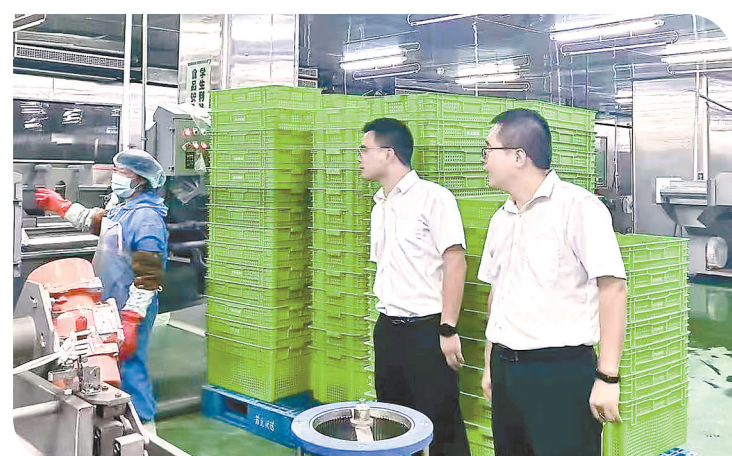
走访了解企业资金需求