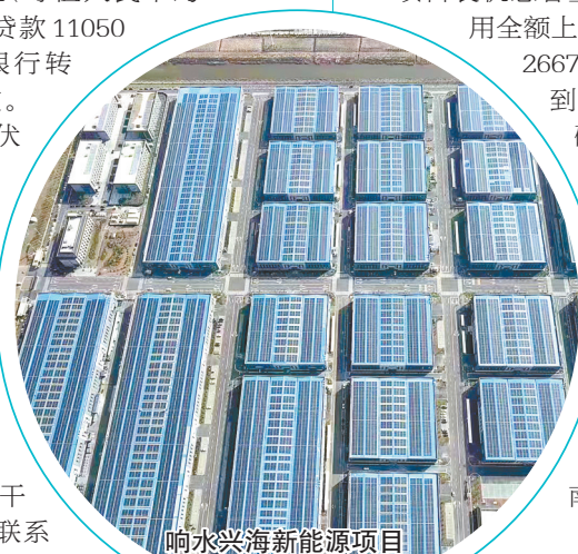
响水兴海新能源项目

藻类是海洋生态系统中最重要的初级生产力,在光合作用下能吸收海水中的氮、磷、有机物和二氧化碳,同时排出氧气,可消除近海