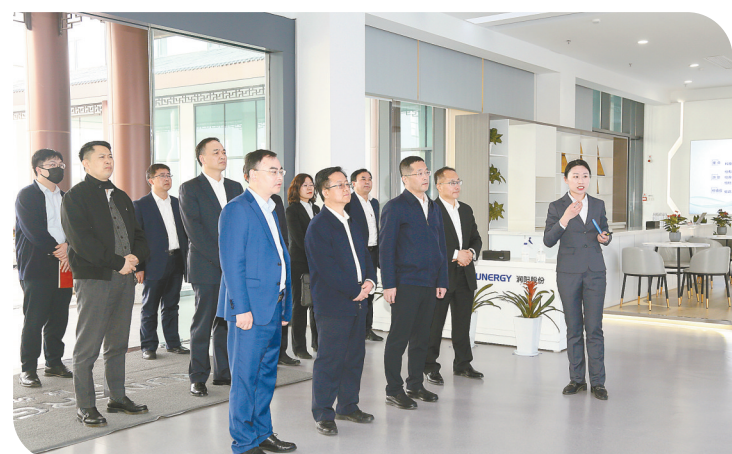
调研江苏润阳新能源公司