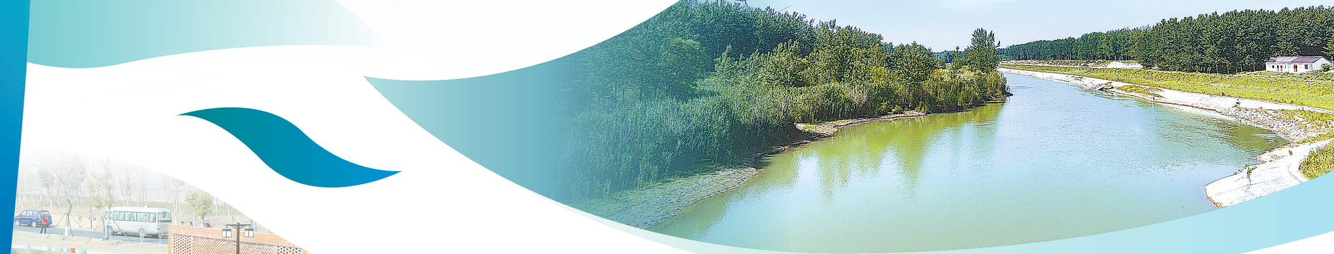
金融支持生态环境保护