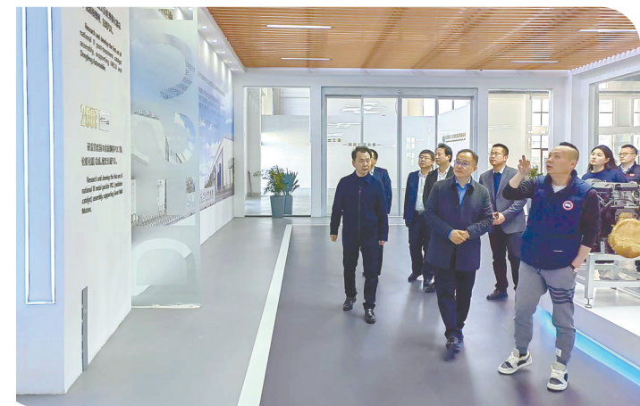
实地走访调研 2023 江苏省重大工业项目