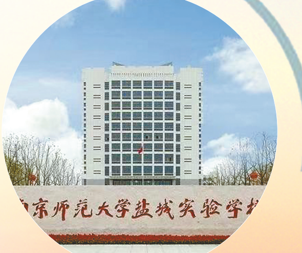
康佳芯片封装项目