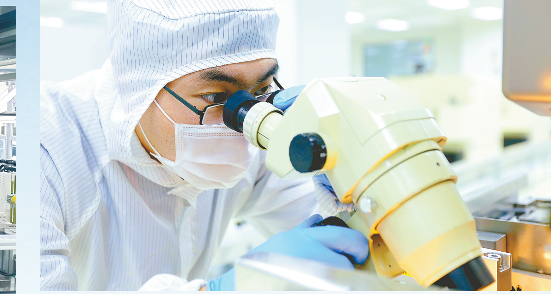
康佳存储芯片封装项目