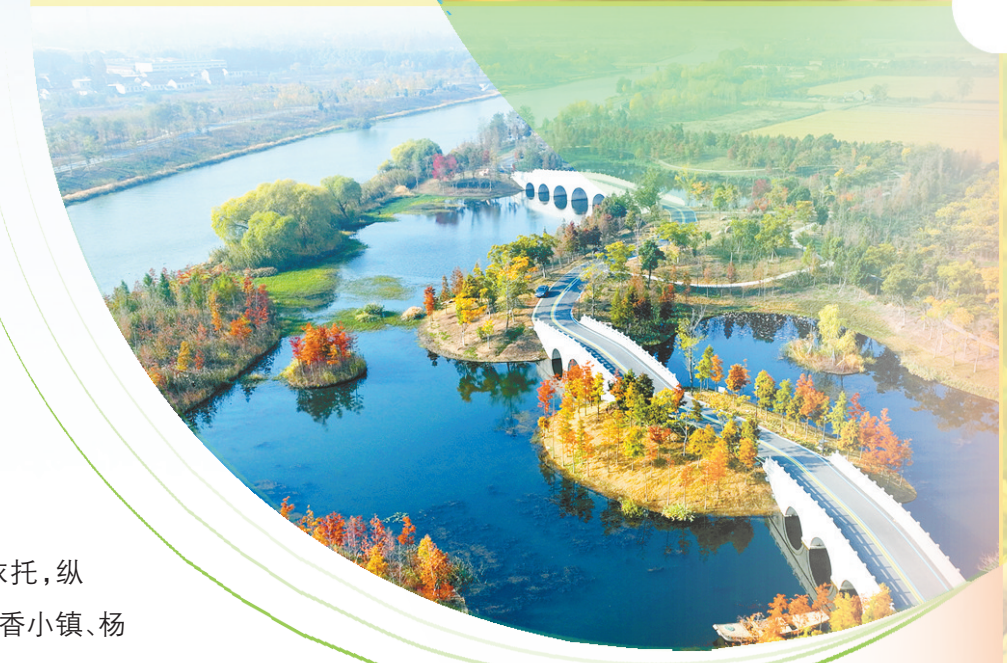
蟒蛇河风光——杨侍镇