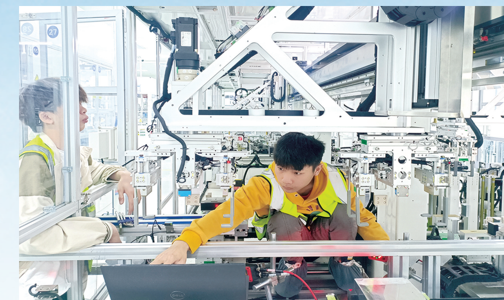
远航锂电锂电项目