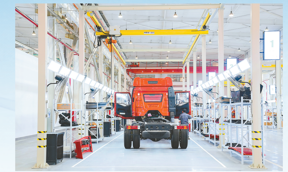
龙创智能锂电项目