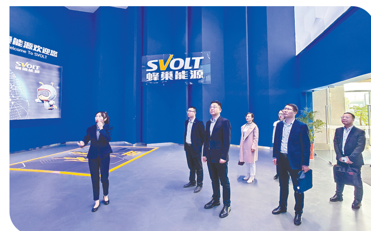
为地方绿色能源企业提供综合化金融服务

深耕盐阜,绿色先行。建设银行盐城分行将根据市委市政府、人民银行盐城市分行、国家金融监督管理总局盐城监管分局相关要求,锚定目标,以金之名,汇金之力,向绿而行,点绿成金,将越来越多的金融“活水”注入绿色产业,助推盐城绿色高质量发展阔步前行。