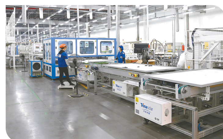
支持绿色制造业企业