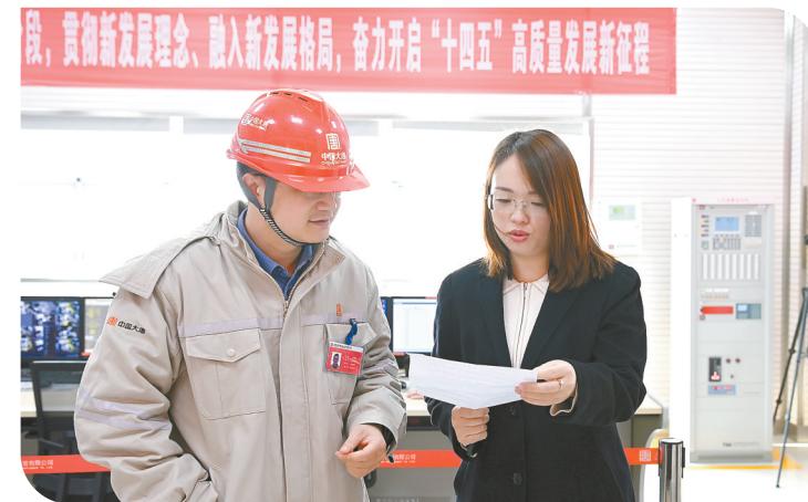
支持地方重点实体企业