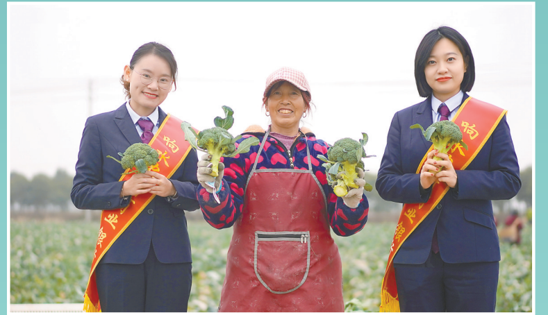
金融支持农村特色产业