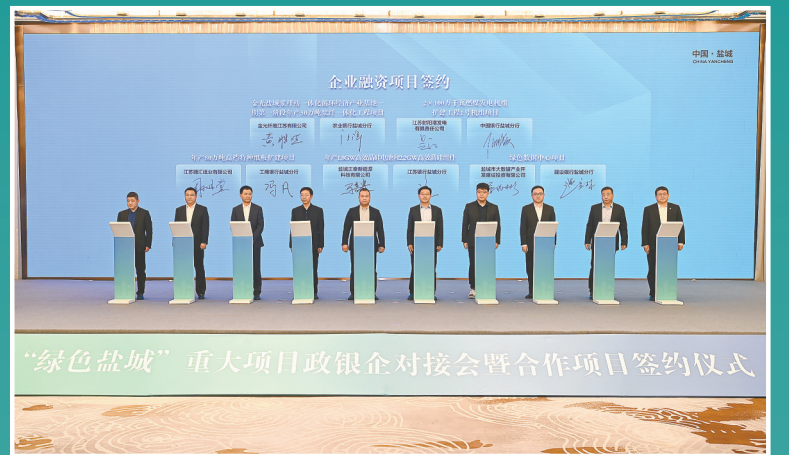
“绿色盐城”重大项目政银企对接会暨合作项目签约仪式