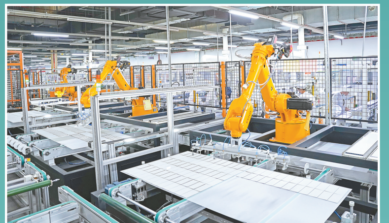
金融全力支持重点绿色制造企业发展