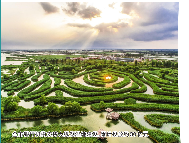
全市银行机构支持大型滩涂湿地建设,累计投放约30亿元