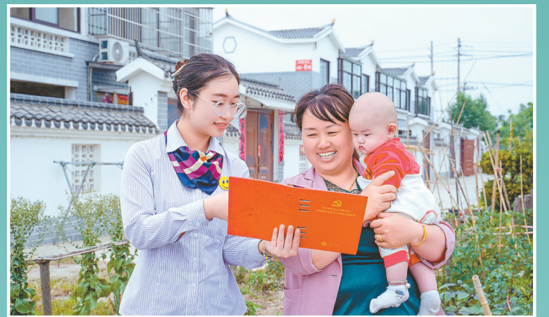
金融助力乡村面貌焕然一新