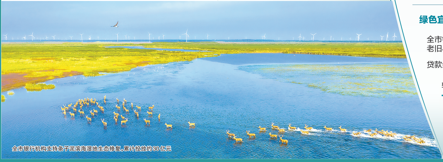
全市银行机构支持条子泥滨海湿地生态修复,累计投放约80亿元