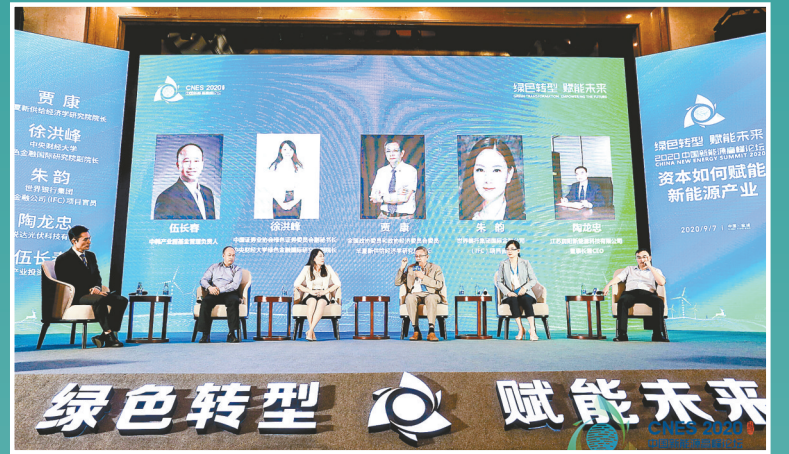
绿色转型 赋能未来