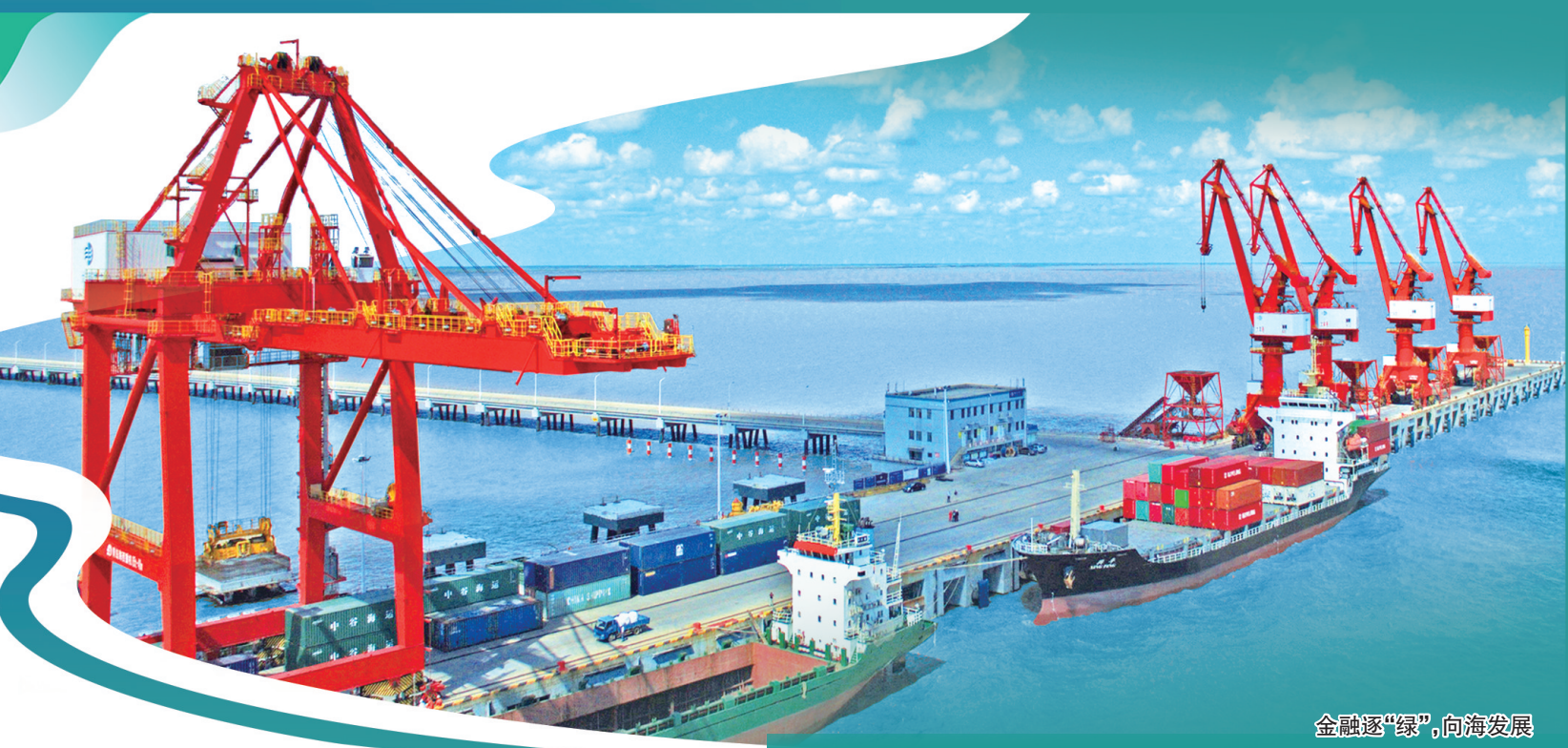
金融逐“绿”,向海发展

向海图强逐绿行,共绘发展新画卷。盐城金融将深入贯彻习近平生态文明思想,贯彻党中央、国务院关于绿色低碳发展战略部署,落实市委、市政府绿色盐城发展规划,加快构建与高质量发展相适应的金融供给体系,与绿色低碳互相协同的金融创新体系,与市域治理现代化相匹配的金融风险防控体系,以金融之力促进全市经济社会全面绿色低碳转型。