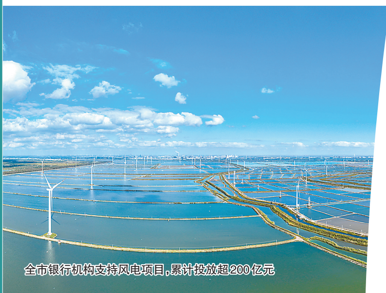
全市银行机构支持风电项目,累计投放超200亿元