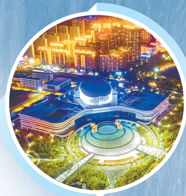
滨海县文化艺术中心夜景

“该项目投资2000多万元建设绿岛智慧管理平台,实时检测能耗、排放等指标,并发挥技术、资金、平台等优势,为全县现有200多家机械制造企业提供集中配套工艺服务,有效解决机械加工企业‘小散乱污’问题。”据滨海县工业园区负责人介绍,绿岛智慧制造服务中心项目总投资32.2亿元,致力打造国内一流机械制造产业服务中心,将带动整个机械制造行业转型升级,实现集约化、规模化、可持续发展。 滨海坚持工业强县不动摇,以“一区多园”建设为牵引,扎实推进“工业经济提质增效年”“招商引资提质增效年”“科技创新提质增效年”三大活动,推动绿色转型,加快建设以实体经济为支撑的现代化产业体系。积极打造高能级平台,提升孵化载体效能,充分发挥省社科院绿色低碳发展研究基地作用,提速建设滨海-灌阳科创飞地、滨海科创园,探索高端新兴产业园、汽车零部件产业园等孵化平台市场化运营机制,不断提高产业“含金量”。此外,该县坚持以科技创新赋能产业转型,以产业需求聚合创新要素,加快推进“智能化改造、数字化转型”。为有效激发创新驱动力,该县实施落实科技创新20条激励政策,发放转型升级奖励资金4611万元,1至7月份实现工业技改投资28.7亿元,同比增长23.5%。矽润半导体获评国家级专精特新“小巨人”企业,启动智慧工业园“无废园区”创建,推动新化、清泉等企业向智能工厂转型,蓝素PHA获评省创新创业大赛一等奖。