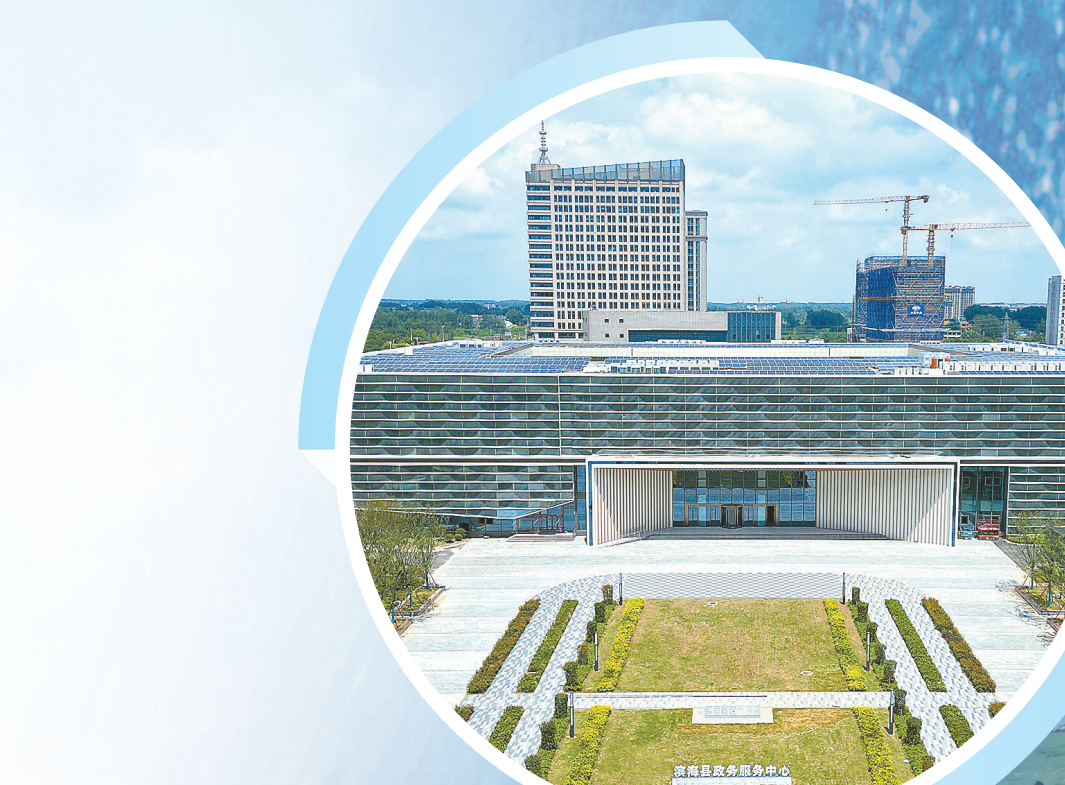
滨海县行政服务中心