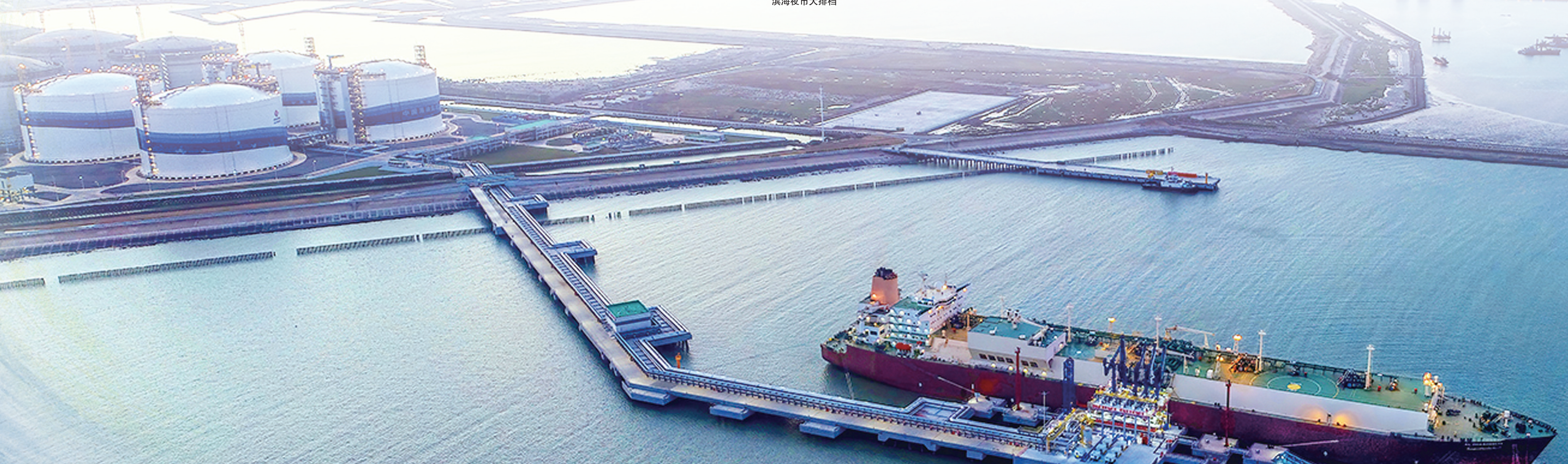
中国海油盐城“绿能港”