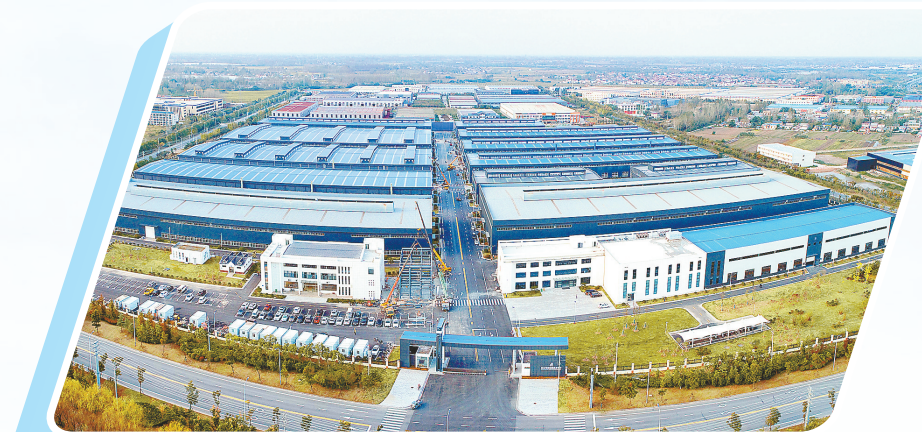
绿岛智能制造中心

中国海油滨海LNG项目自投产以来,接卸的液化天然气总量突破200万吨,相当于气态天然气约28.6亿立方米,按照2022年江苏省居民每月用气量约4.26亿立方米计算,可供全省民生用气约7个月,在充实华东地区天然气储备的同时,不断推动区域能源结构优化转型,有力促进绿色能源产业高质量发展。 依托滨海片区这一重大战略空间,滨海始终坚持绿色发展引领港口发展,开展海洋经济先行探索,冷能应用综合示范,深化与中海油、国信等央企国企合作,探索“风光火气氢”一体化开发,实现风电、光伏、LNG全产业链布局,加速集聚绿色能源、新能源装备制造、电池正负极材料、新材料、现代物流等千亿级产业集群。今年提速推进国信火电、国信锂电等重大项目,推动中海油LNG二期扩建项目在蓝湾、保障+石油LNG、国信火电扩建、2000MW储能电站项目开工建设,探索开展火电机组CCUS示范、绿电制绿氢等,完善多能互补、安全高效的能源体系。 滨海聚焦新能源装备制造、新材料、LNG关联产业等,推动金富力正极材料等项目启动建设,加快推进换冷站、冻干果蔬、冷水养殖等LNG冷能利用项目,确保上海风电主机、金海电解液等项目竣工投产,努力突破金光二期、林德气体等重大外溢项目。启动低(零)碳园区核心区建设,打造“绿电、绿证、碳排放权”市场交易中心,争取“源网荷储”一体化项目纳入省级示范,探索新能源直供电模式,让绿色能源成为滨海最醒目的发展标识、最具吸引力的投资要素。