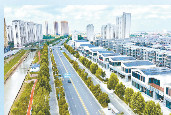
宜居宜业的县城环境