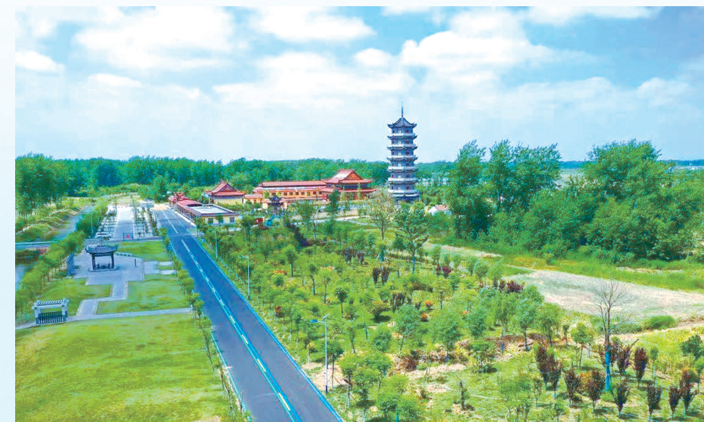
灌河新八景——云梯绿海

红色文化、绿色生态、蓝色海洋“红绿蓝”三色旅游,响水加快农文旅融合发展势头强劲,全域旅游美丽画卷已经铺展。