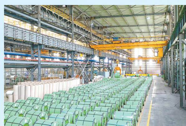
千亿级不锈钢产业龙头——德龙集团