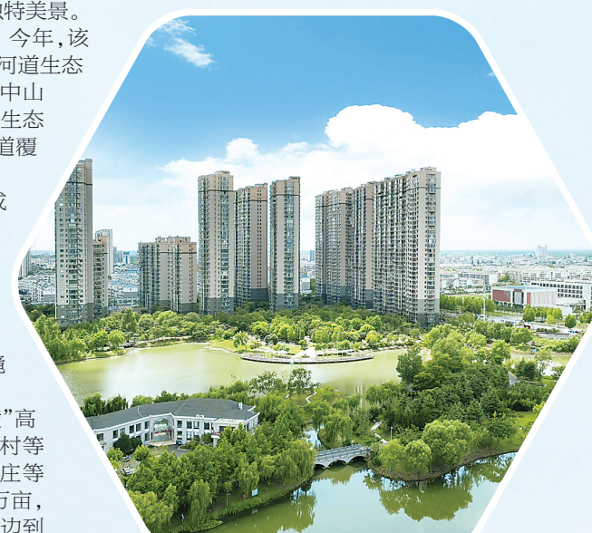
风光旖旎的城市公园

目前,响水县已拥有“六纵六横”高标准绿化带,灌河村、六港村、五套村等36个省级绿化村庄,又申报2个村庄等待审批。全县湿地面积增加到23万亩,林木覆盖率提升至25.4%,从灌河岸边到黄河故道绿化联动计划实施有力,响水镇七排河、唐响河廊道绿化,黄河故道片区景观绿化等应运而生,绿色底蕴更加浓郁。