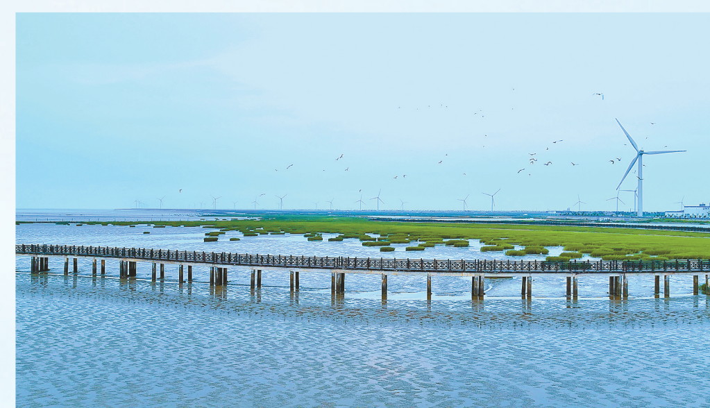
打卡新地标——海上栈桥