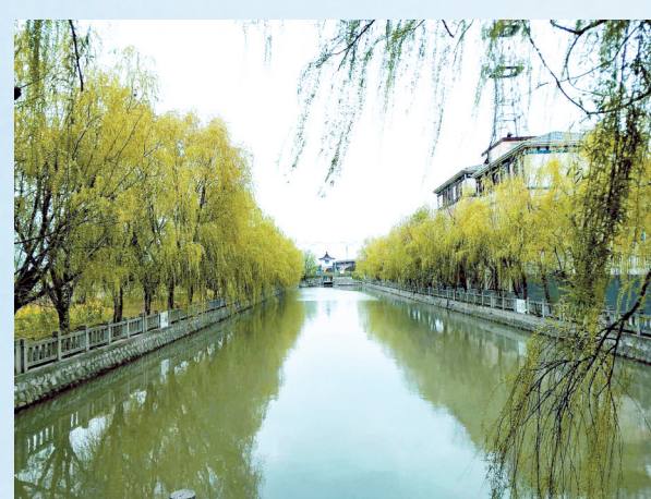
水清岸绿的城乡河道