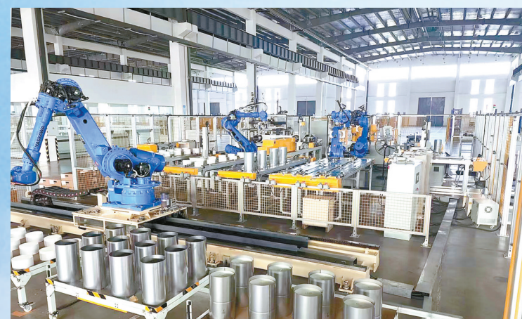
全市首家“黑灯工厂”——德森汽车部件

“绿色是响水最鲜明的底色,也是最大的发展优势和潜力,我们牢固树立‘绿水青山就是金山银山’的发展理念,以建设绿色低碳发展示范区为总抓手,坚定不移举生态旗、打生态牌、走生态路,争当淮河生态经济带、黄河故道沿线高质量发展排头兵,以一域之光为全省全市发展大局助力添彩。”响水县委书记郭超表示。