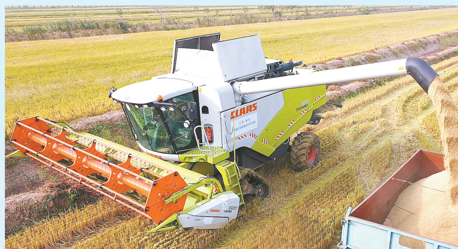
生态品牌——康庄大米香飘长三角

绿色蕴含了企业高质量发展理念,也“触媒”出响水绿色低碳产业强劲的发展脉动。总投资120亿元的展辰新能源储能能电芯项目成功签约,50亿元的乾运高科磷酸锰锂正极材料项目开工建设,年产220万套汽车排放总成产业园项目奠基开工……一个个科技含量高、发展前景好的重大项目竞相落地,为加快建设低(零)碳园区汇聚磅礴力量,掀起了现代工业高质量发展“绿色浪潮”。