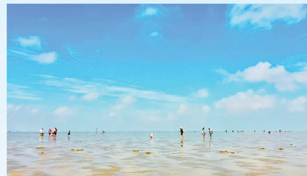
游人如织的网红海滩