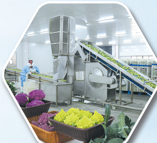
全国行业首个碳标签 西兰花智能化生产线

绿色生态铺就致富路,通过“八园”同创,串珠成链,打造绿色生态富民康庄,西兰花、鲜食玉米、浅水藕、优质稻米等品牌越叫越响,现代农业发展全面起势,农业强、农村美、农民富的新时代鱼米之乡壮美画卷徐徐展开。