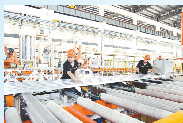
设备水平国际领先——高卡轻合金