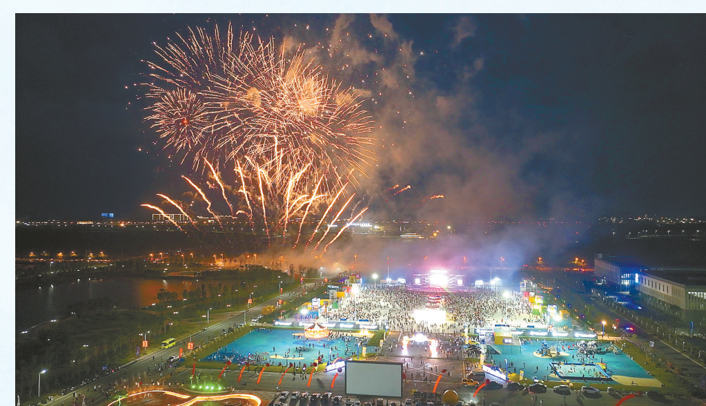
万人爆棚的渔火夜市