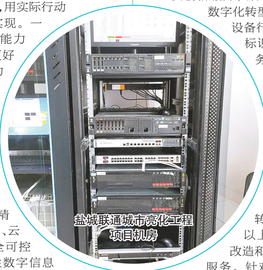
盐城联通城市亮化工程项目机房

盐城联通持续深化绿色网络合作,积极推进基础设施共建共享,发挥合作各方资源互补优势,减少社会资源重复消耗。积极推进基站、管道、杆路等通信基础设施共建共享,减少土地、钢材、能源和原材料的消耗,充分利用已有资源,提高基础设施利用效率。