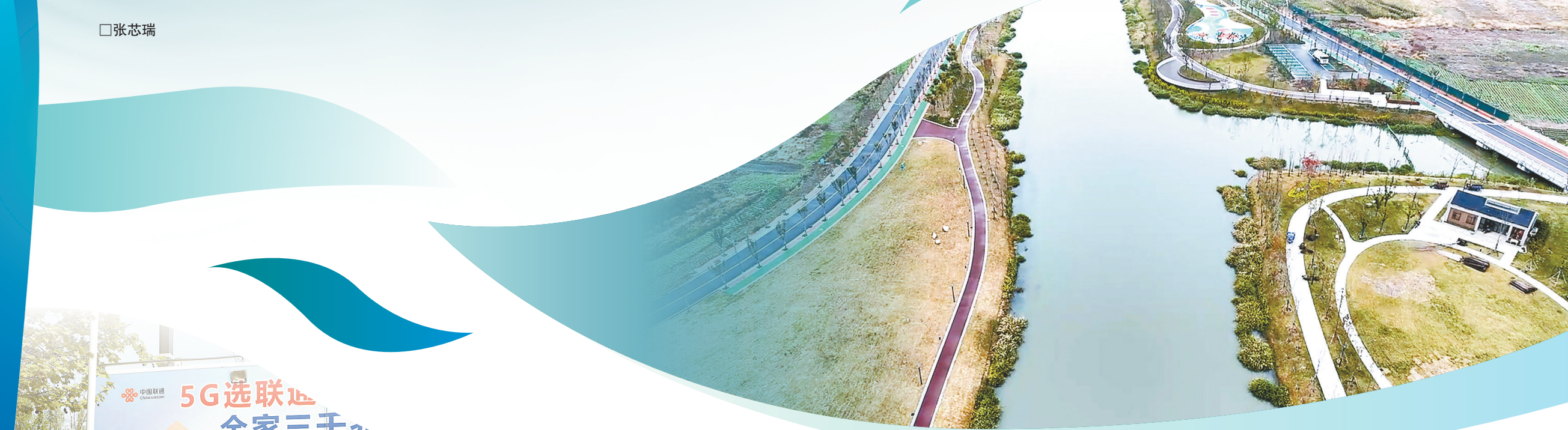
市智慧河长制管理平台无人机巡河,河道状况尽收眼底