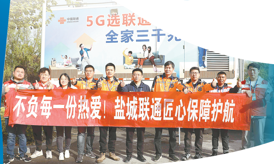
盐城联通通信服务保障团队