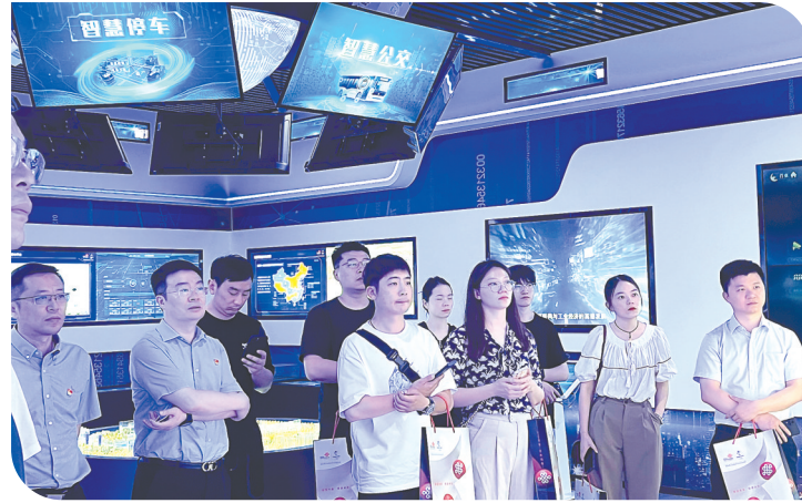
盐城联通国企开放日创新业务展厅现场