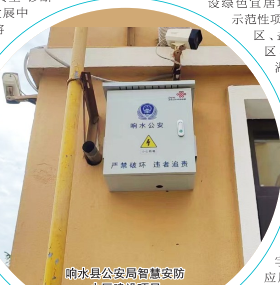
响水县公安局智慧安防小区建设项目

的堵点、痛点和难点,将5G、云计算、大数据、物联网、人工智能等新技术深度融入制造业全流程,帮助企业制定“一企一策”个性化解决方案,帮“不想转”的企业提高意识,给“不敢转”的企业解除顾虑,为“不会转”的企业明确路径,快速地将企业引领到数字经济新赛道,以数据驱动产业升级,实现企业提质、增效、降本、绿色和安全发展。