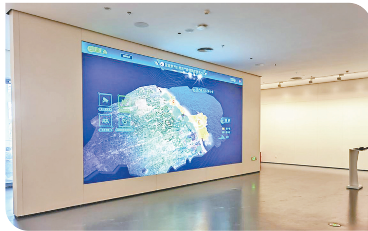
中国黄海湿地博物馆生态监测平台