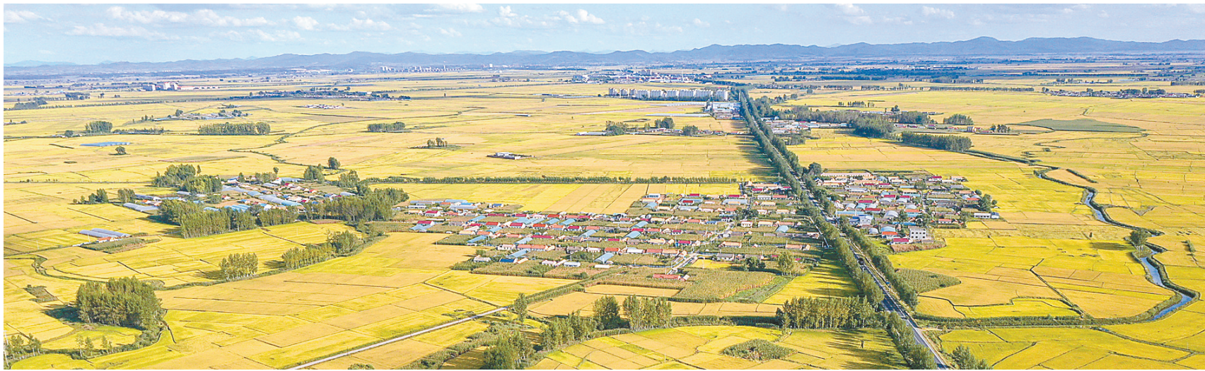
这是万昌镇水稻田(9月12日摄，无人机照片)。