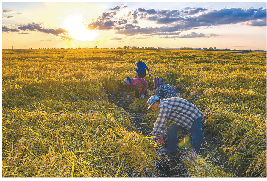
9月12日，在万昌镇花家村，农民在收割水稻。金秋时节，稻浪滚滚，吉林省吉林市永吉县万昌镇的水稻陆续开镰收割。万昌镇位于“世界黄金水稻带”，2023年水稻种植面积12.5万亩，是吉林省水稻重要主产区之一。