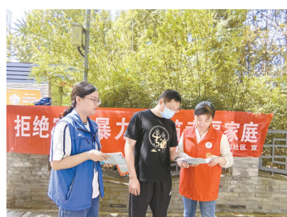
9月8日,亭湖区大洋街道毓龙公园社区新时代文明实践站,社区妇联开展以“拒绝家庭暴力,共筑幸福家庭”为主题的反家庭暴力知识宣传。倪源源 摄

2018年以来,该镇累计开展道德讲堂近180期,各类新时代文明实践和志愿服务活动近800场(次)。先后涌现“中国好人”2名,“盐城道德模范”1名,江苏省“最美基层共产党员”1人,“文明家庭”覆盖率超过85%。