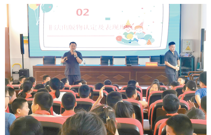
9月7日,亭湖区黄尖镇新时代文明实践所和区法院联合学校开展了“扫黄打非”进校园主题宣传活动,引导学生阅读积极健康读物,拒绝有害出版物及有害信息,养成绿色阅读好习惯,自觉文明上网、安全用网,树立正确观念,筑牢自我保护防线。

善等重点,开展以“四清一治一改”为重点的环境整治突击月专项行动,推动农村人居环境持续向好。集中精力推进土地流转。以“小田变大田”示范镇打造为契机,该镇党委充分发挥把方向、管大局、促落实的作用,压实村级主体责任,针对农户田块大小、质量以及种植意愿等情况进行具体分析、分类施策,合理划分“流转区”“置换区”,通过“置换连片”的模式,推进零星耕地地块整合及空间置换腾挪,将“小田变大田”工作成果转化为富民兴村产业发展成果。想方设法抓好“一村一品”培育。对照年初“一村一品”工程”制定的目标任务,形成“一村一品”“多村一品”产业特色。加快实施罗杨路西延段路灯建设工程、乡村道路提升工程、公益性公墓建设工程、古风路绿化提升工程。