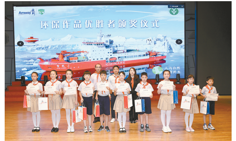
活动现场