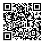
扫一扫 看视频