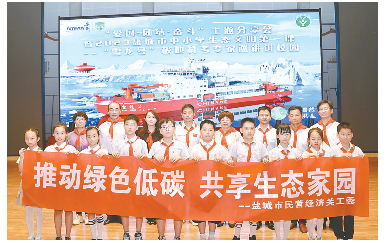
推动绿色低碳 共享生态家园