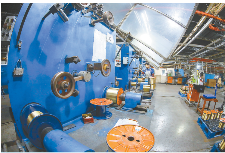
位于东台经济开发区的磊达钢帘线持续加大技改投入，提升市场竞争力，助力打造“零外购电”先进制造企业。目前，该公司已形成18兆瓦分布式光伏新能源发电能力，每年可生产清洁电能1800万千瓦时。项目全部建成后采用自发自用、余电上网模式，每年可减少生产购电1950千瓦时，实现经济效益1650万元。

在盐城本地生产的悦达起亚汽车，同样期待政策发力，带来实际增长效果。在捷翔4S店和嘉华4S店，记者看到，前来购车的新客户越来越多，销售人员接待热情，服务周到。“看到政府出台惠民补贴政策后，家里就商量赶紧买一台车，考虑到悦达起亚是我们盐城本地生产的，质量有保障。”（下转2版）