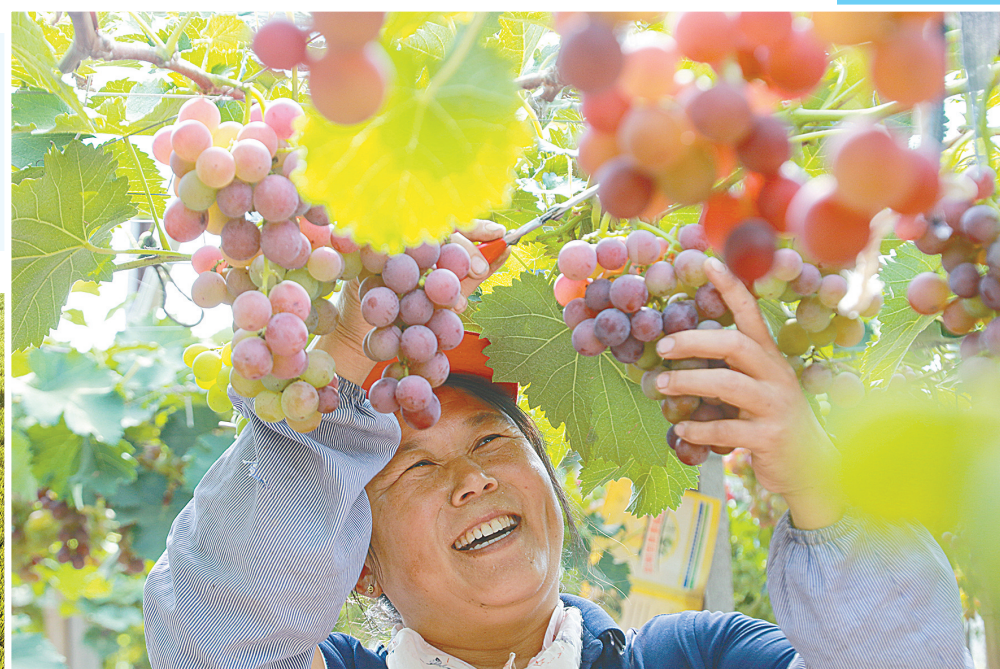
9月7日,山东省高密市阚家镇松兴屯村葡萄大棚内,村民在采摘葡萄。