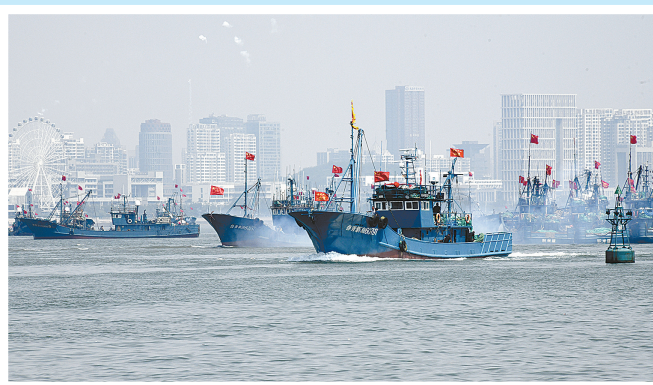
9月1日,渔船从位于山东省青岛西海岸新区的积崖崖中心渔港驶出。