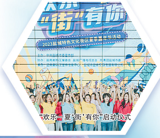
“欢乐一夏‘街’有你”启动仪式

表达形式创新。注重活态传承。在盐城,从线下“淮剧小镇”到线上“中华淮剧”,从东台发绣的“穿针引线”到数字化活态传承的“宋画复活”,从市博物馆NPC探秘剧、“夜韵盐博”到市美术馆的《伟大的作品》魔幻情景剧、跨媒体艺术展,再到海盐博物馆