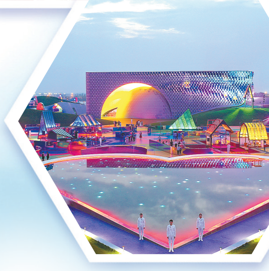
荷兰花海戏剧幻境

学古不泥古、破法不悖法,才能实现中华优秀传统文化的创造性转化、创新性发展。近年来,盐城市大力探索历史文化挖掘、文艺精品创作、文化新型传播等文化传承发展新路径,努力提供体系化、多样化和优质的文化服务。