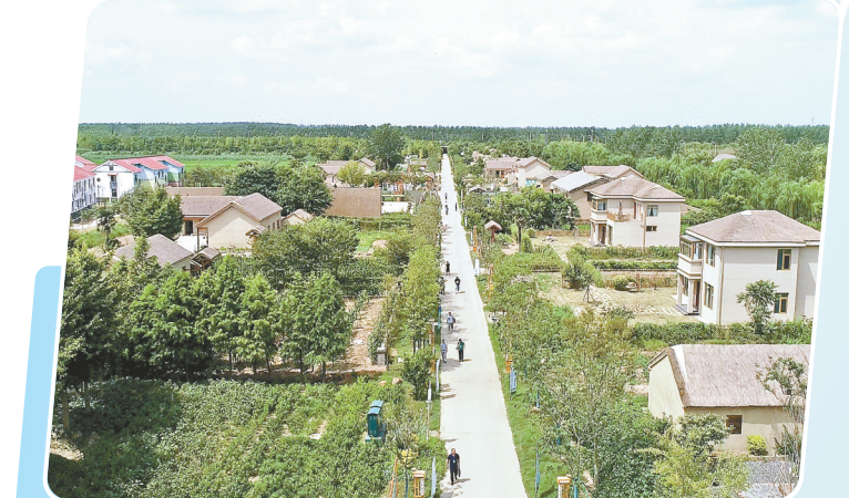
亭湖区黄尖镇潮间带艺术村