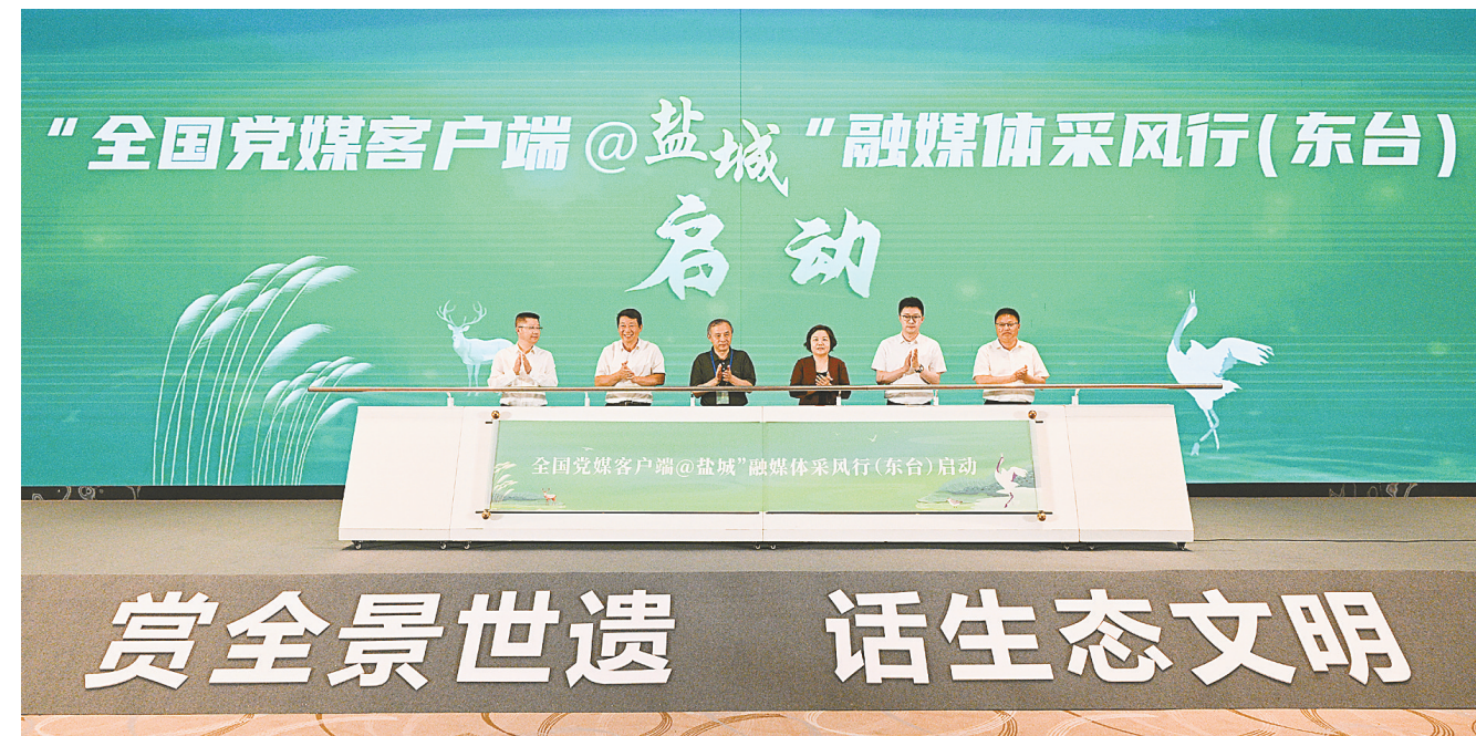
“全国党媒客户端@盐城”融媒体采风行(东台)启动仪式

活动期间,与会嘉宾深入生态保护一线,沉浸式体验世界自然遗产地、国际湿地城市之美,用生花之笔、生动镜头展示美丽中国的生态文明成果;展开一场场“头脑风暴”,从不同维度就当前媒体融合发展与战略传播的前沿话题进行深度研讨,共同推进主流媒体加速深度融合,合力书写全媒体时代的崭新篇章。