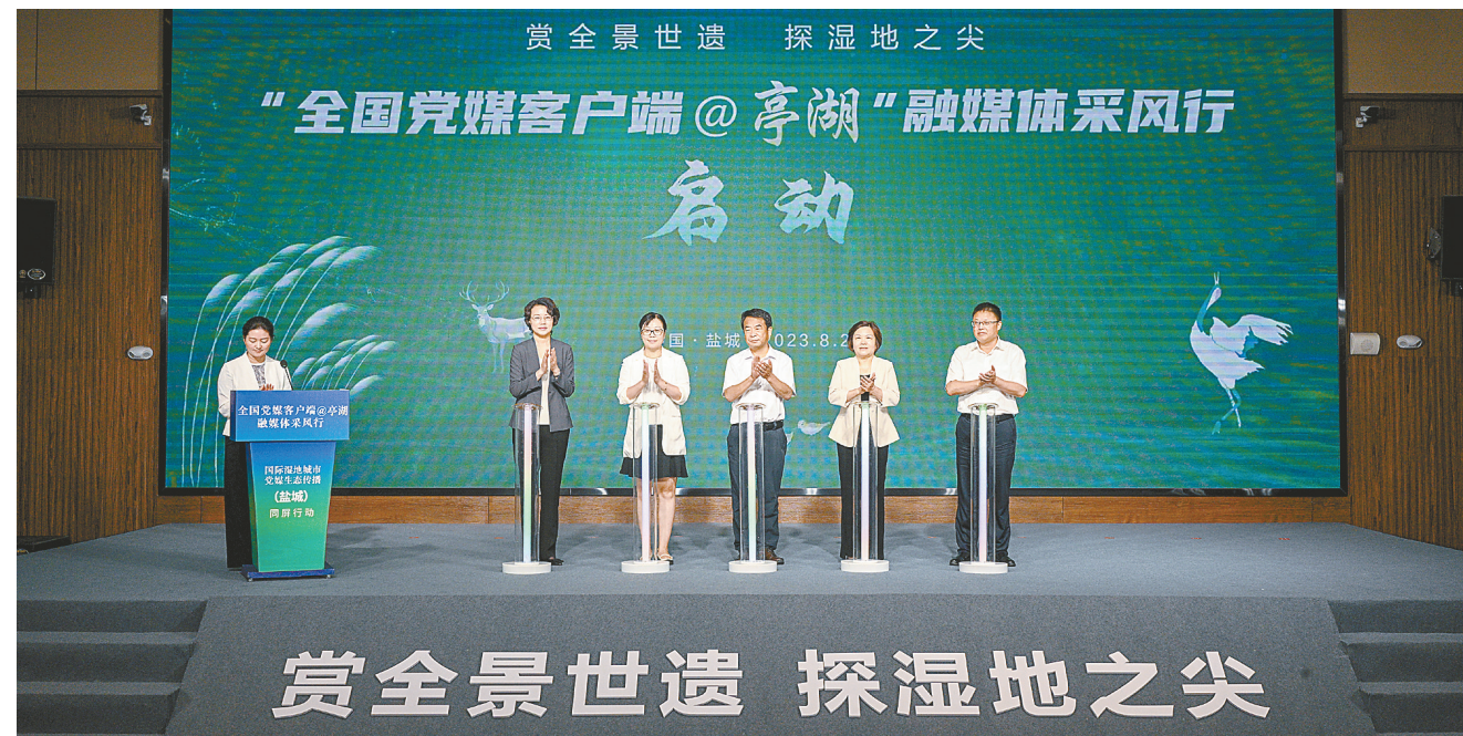
“全国党媒客户端@亭湖”融媒体采风行启动仪式