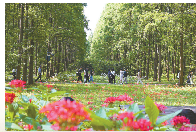
林草丰茂的黄海森林公园