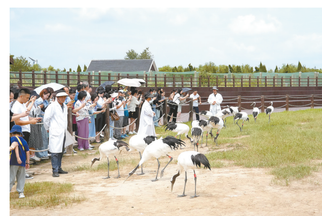
参观丹顶鹤保护区