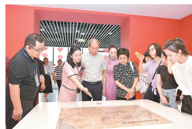
在竹林大饭店采风