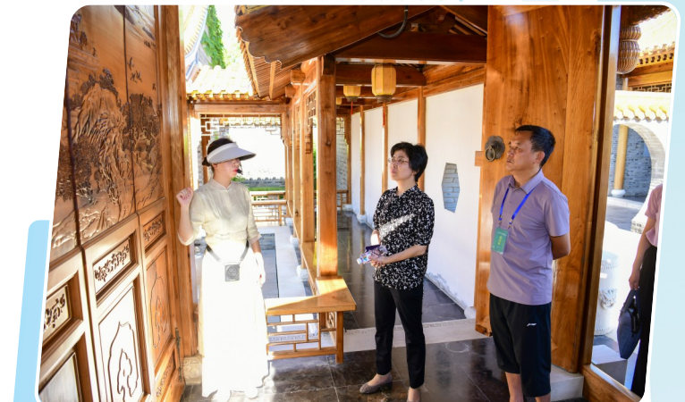
在大洋湾景区采风