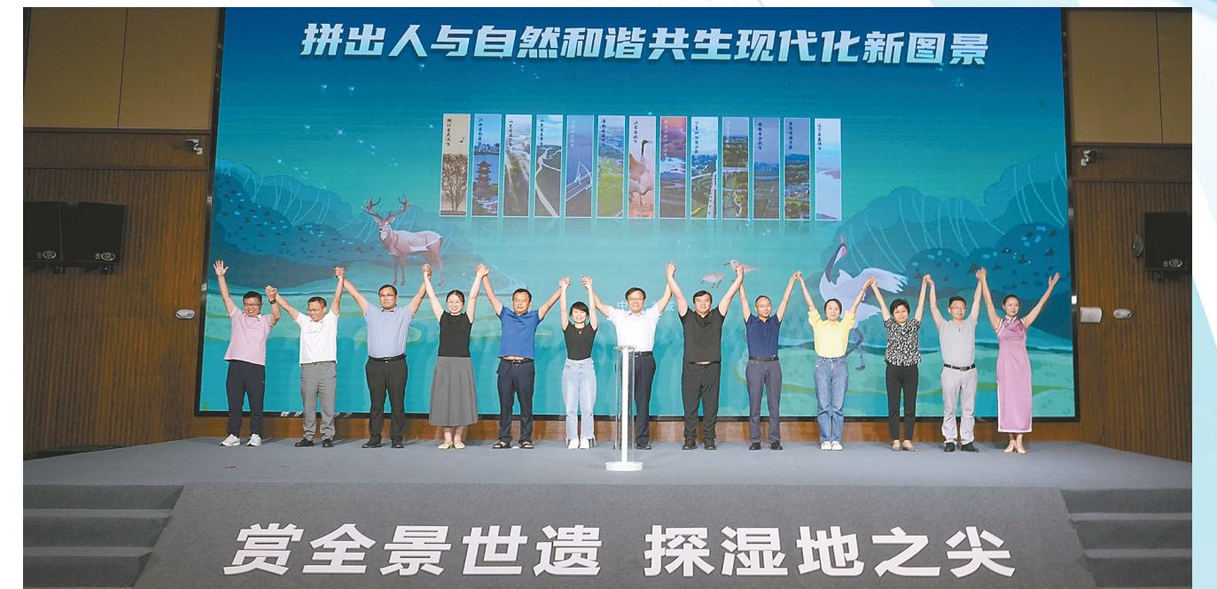
13个国际湿地城市同屏行动