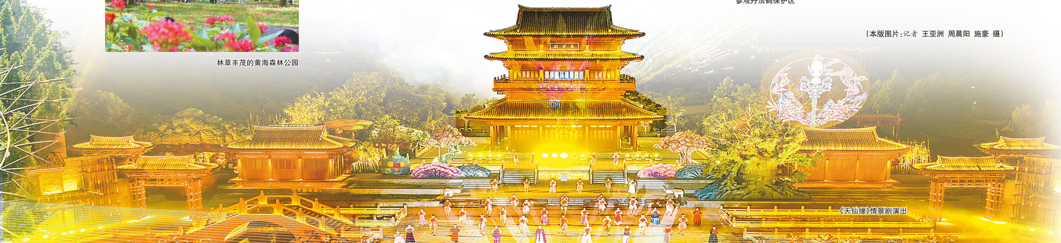
《天仙缘》情景剧演出