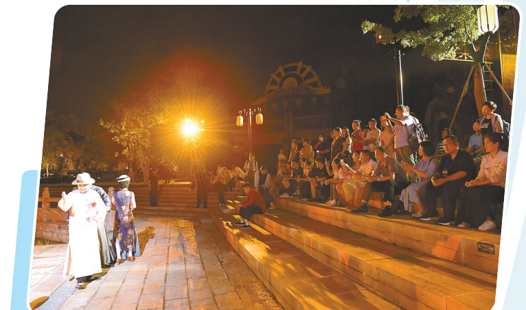
观看大洋湾景区演出