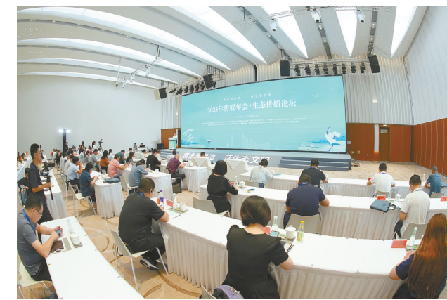
2023年传媒年会·生态传播论坛

“浩瀚的黄海给了盐城最美的生态,也赋予盐城澎湃的发展动力。”中国新闻文化促进会副理事长、光明日报社原副总编辑陆先高是生态环境部聘任的生态环境特邀观察员,他充分肯定,盐城探索出了一条逐绿前行、因绿而兴、绿满金生,以绿惠民的可持续发展之路。