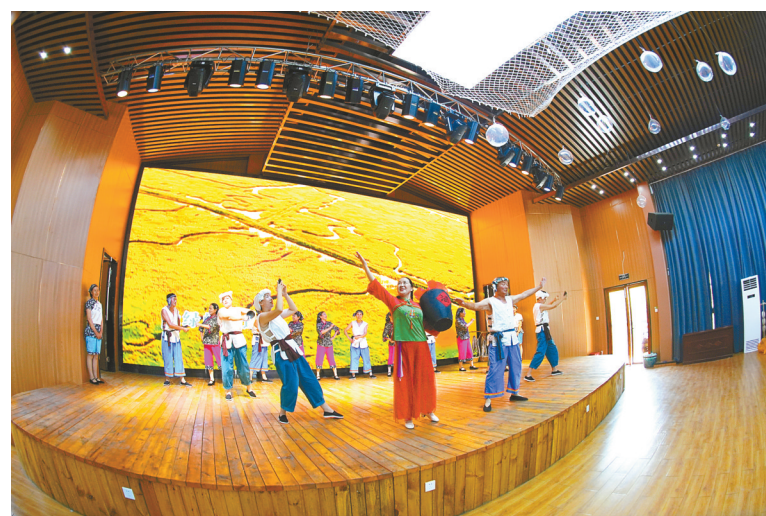
巴斗村“渔港号子”表演