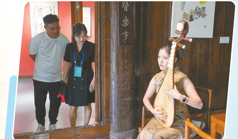
潮间带艺术村艺术表演