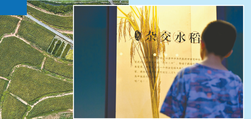
暑假期间,许多家长带着孩子来到湖南省长沙市芙蓉区的隆平水稻博物馆,了解水稻的生产过程和发展历史,感受粮食的来之不易,让孩子们从小树立爱粮、惜粮、节粮的意识。