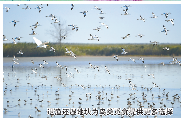
退渔还湿地块为鸟类觅食提供更多选择