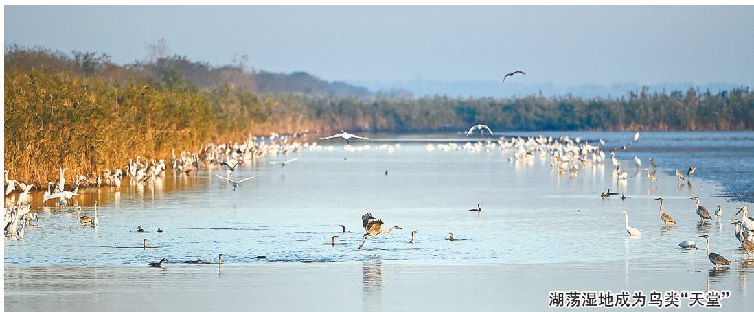
湖荡湿地成为鸟类“天堂”

盐城是一座湿地上诞生的城市,是世界自然遗产地城市,兼具湿地、海洋、森林三大生态系统,拥有长三角最大的绿肺、最好的空气、最多的珍稀鸟类,创成国际湿地城市、国家森林城市、国家生态文明建设示范区。以更加开放的姿态拥抱世界,共同绘就更加诗意的生活画卷,盐城正为湿地保护融入城市发展提供城市样本和范例。