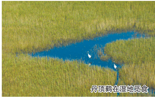
丹顶鹤在湿地觅食