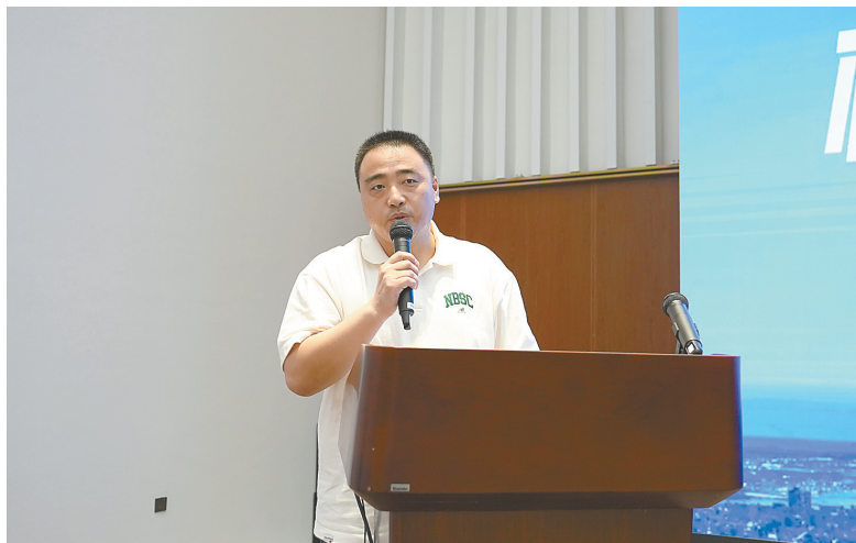
洋河股份盐城分公司负责人致辞