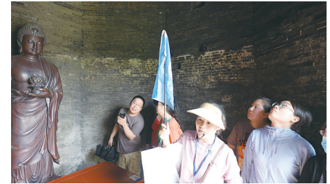
粉丝参观海春轩塔