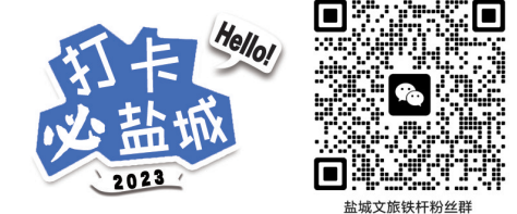
盐城文旅铁杆粉丝群