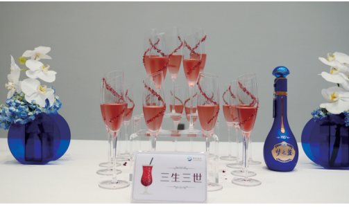
用梦之蓝调配的系列鸡尾酒