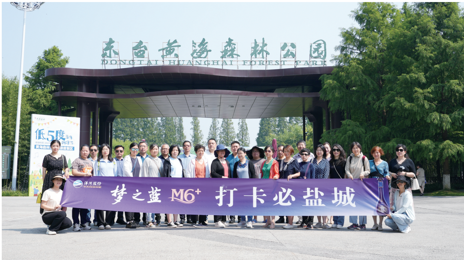
梦之蓝 M6+ 打卡必盐城