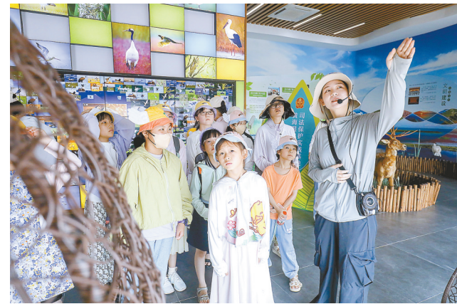
孩子们参观鸟类博物馆。

8月15日是首个全国生态日。当天,《走进自然遗产,呵护大美湿地》公益讲座和爱鸟自然笔记研学活动在世界自然遗产核心区、候鸟天堂条子泥湿地开展。老师手把手地教参加活动的孩子操作专业工具、观鸟识鸟,并参观鸟类博物馆,引导大家用创作自然笔记的形式,展示呈现所学知识。