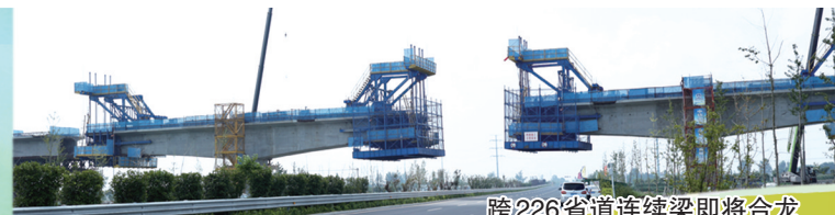
跨226省道连续梁即将合龙