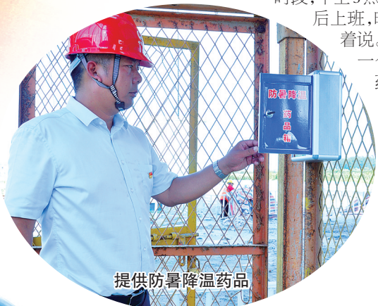
提供防暑降温药品

通榆河生态红线保护区和江苏大丰麋鹿国家级自然保护区,在施工过程中,各标段注重人与自然的和谐共生,不断优化施工方案,尽量降低对既有生态环境和麋鹿生活环境的影响。