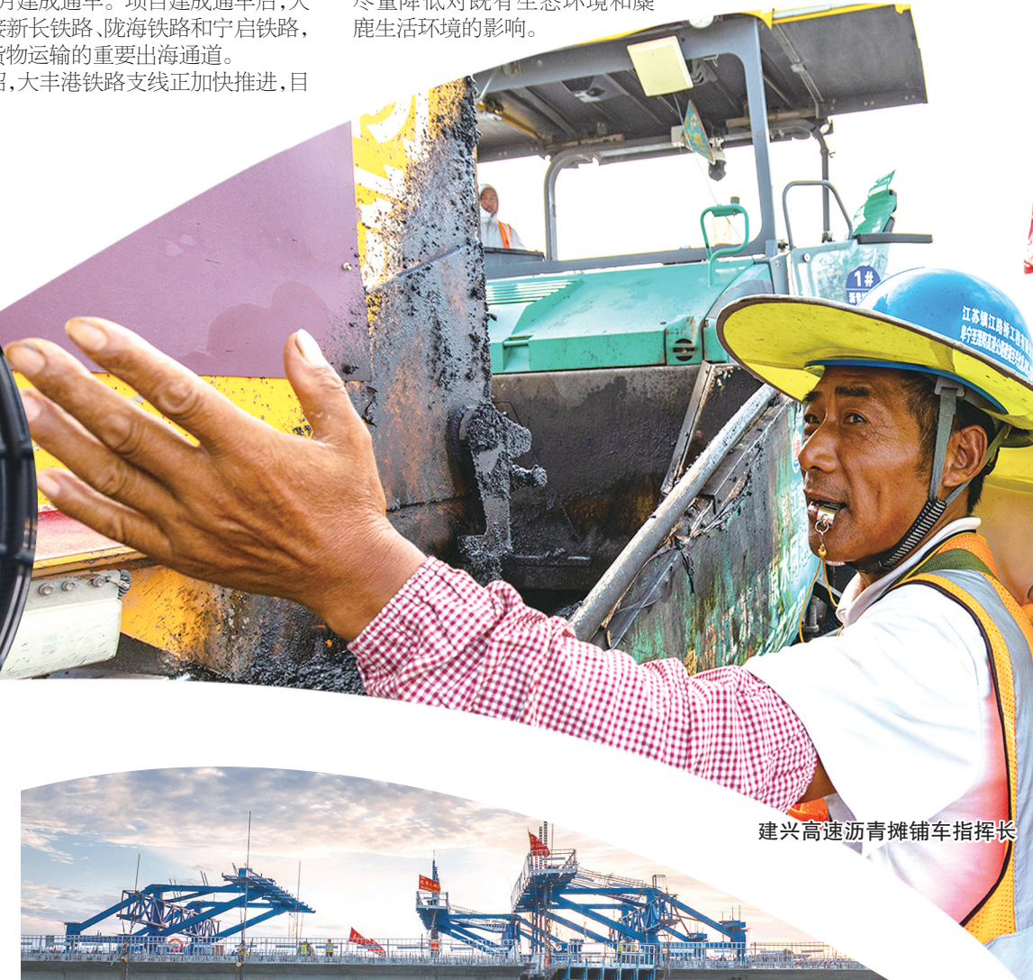
建兴高速沥青摊铺车指挥长