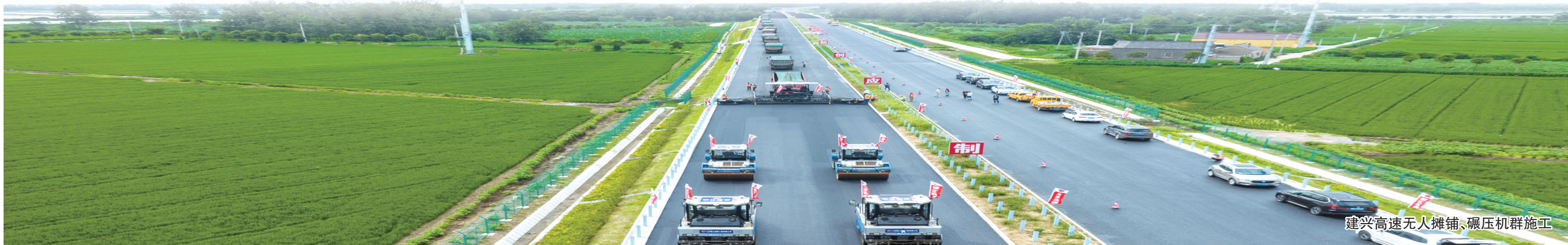
建兴高速无人摊铺、碾压机群施工