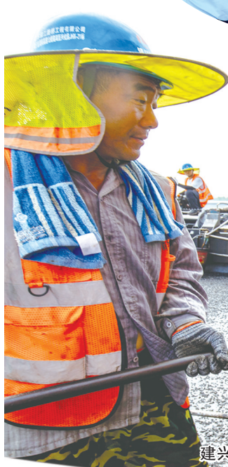
建兴高速沥青摊铺现场施工