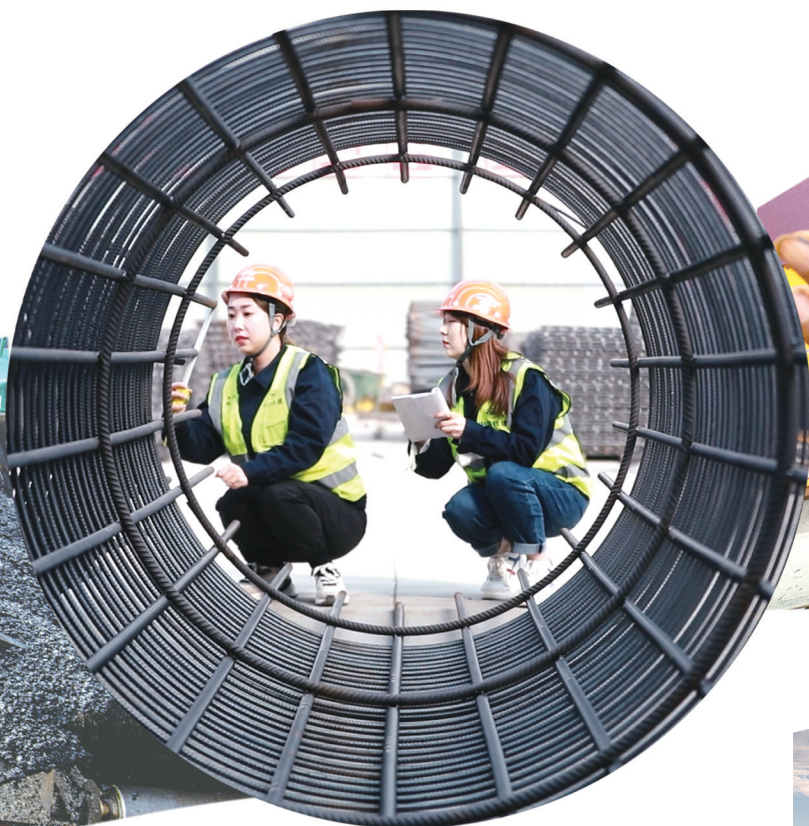
建兴高速上质量检测“姐妹花”