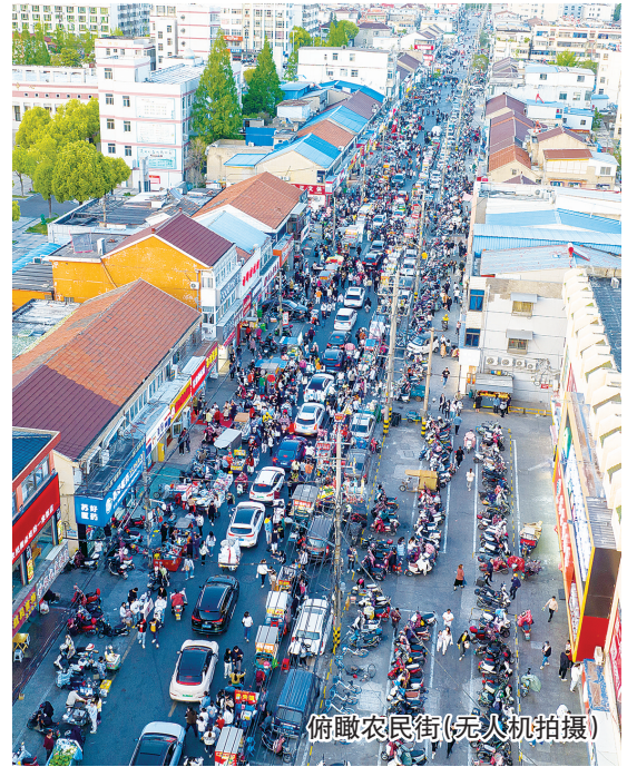
俯瞰农民街(无人机拍摄)

作为“网红”美食的集聚地,这里既有刚新兴起来的“网红”小吃,也有久经考验的传统美食。山东的杂粮煎饼、安徽的木柴馄饨、老北京的鸡肉卷……天南海北的味道汇聚于此,不仅让本地市民大饱口福,还吸引了不少外地游客。