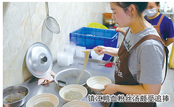
镇江鸭鸭粉汤汤颇受追捧