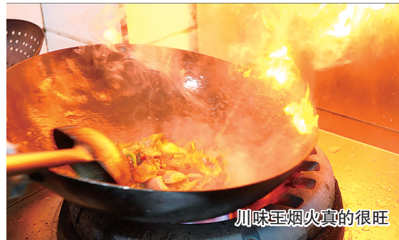
川味菜烟火真的很旺

大街小巷升腾的“袅袅烟火”,蕴藏着城市的活力,传递着盐城人的幸福生活。来吧!与三五好友一起,漫步农民街,尽享这里的繁华与热闹、安宁与美好。