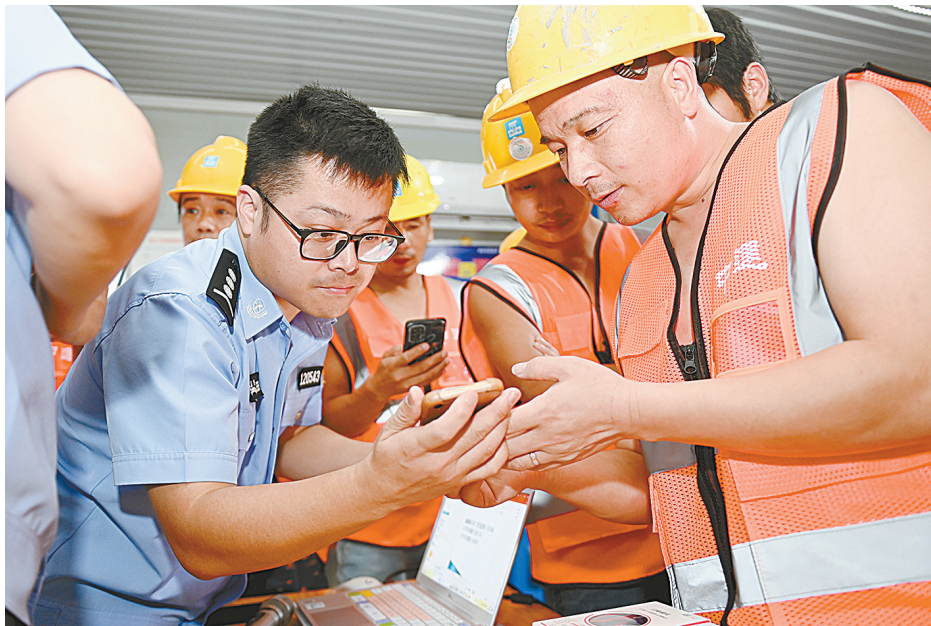
8月3日,辖区派出所民警在为外来务工人员设置手机防范电信网络诈骗相关软件。

此外,诈骗人员跨境作案,手法日趋高科技化。“随着国内打击力度不断加大,一些诈骗人员把窝点转移至境外,使用成本更低、隐蔽性更强、操作更简单的新型‘简易组网GOIP’设备,操控境内手机拨打诈骗电话,具有很强的伪装性,老百姓很难分辨。同时,也给取证等带来巨大挑战。”一名办案人员表示。