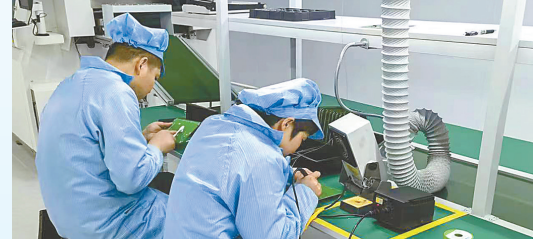
追锋车载功放项目: 该项目由追锋汽车系统(杭州)有限公司投资建设,当期投资1亿元,年产车载功放系统40万套。