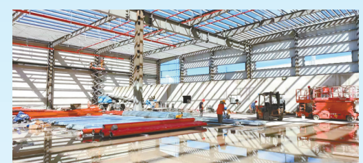
佛吉亚1000万套高强度滑轨项目: 该项目由佛吉亚(中国)投资有限公司投资建设,当期计划投资10亿元,年产高强度滑轨1000万套。