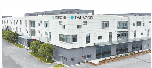
大因多媒体项目: 该项目由上海大因多媒体技术有限公司投资建设,当期投资10亿元,年产会议系统、智慧屏10万台套。