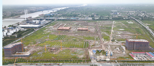
海富纸制品项目: 该项目由江苏海富包装科技有限公司投资建设,当期计划投资30亿元,年产纸版2.4亿平方米、纸箱1.8万吨、卡盒1800万个、坑盒6000万个。