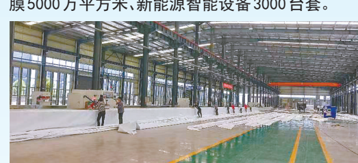
贝加尔新型环保膜结构新材料项目: 该项目由贝加尔(江苏)新材料有限公司投资建设,当期计划投资5亿元,年产新型环保膜结构新材料500万平方米。