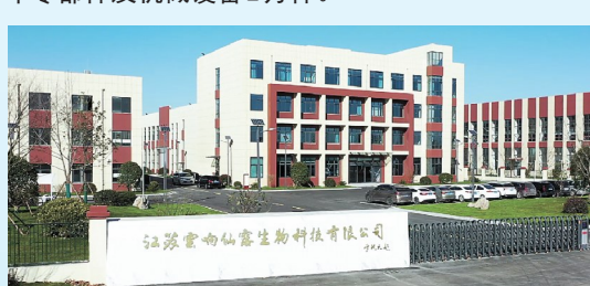
云梯仙草铁皮石斛深加工项目: 该项目由江苏云梯仙草生物科技有限公司投资建设,当期投资1.5亿元,年产固体饮料50吨、液体饮料4000吨、含片50吨。