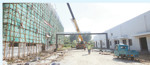
丰山全诺二次电池电解液项目: 该项目由南通全诺新能源材料科技有限公司、江苏丰山集团股份有限公司投资建设,当期计划投资5亿元,年产二次电池电解液10万吨。