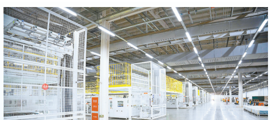
通威光伏产业基地项目: 该项目由通威股份有限公司投资建设,当期投资45亿元,年产光伏组件25GW。