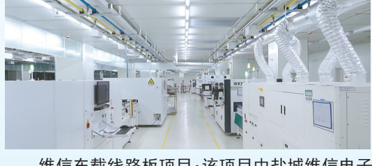
维信车载线路板项目: 该项目由盐城维信电子有限公司投资建设,当期投资10亿元,年产车载线路板450万平方米。