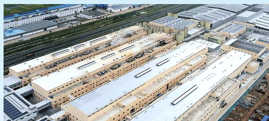
金田纸业二期项目: 该项目由东莞市金田纸业有限公司投资建设,当期计划投资30亿元,年产白板纸90万吨。