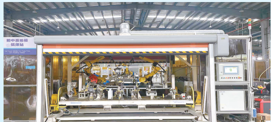
多利汽车零部件项目: 该项目由滁州多利汽车科技股份有限公司投资建设,当期投资15亿元,年产高端合金车身、汽车底盘和汽车底盘相关零部件10万台套。