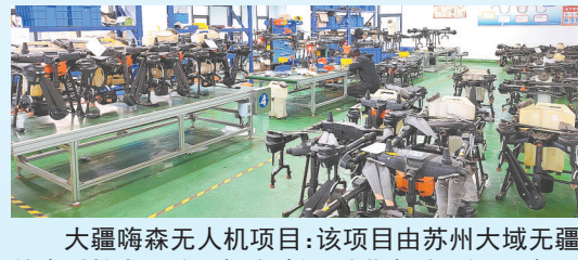
大疆嗨森无人机项目: 该项目由苏州大域无疆航空科技有限公司投资建设,当期投资1亿元,年组装农业植保无人机5000多台套,建成全国第一个标准化二手无人机更新生产线和全国最大的二手无人机零配件基地。