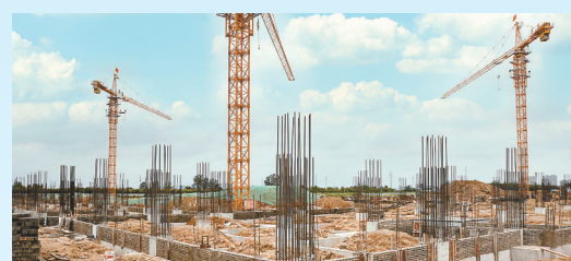
通行光伏芯片模块、接线盒项目: 该项目由江苏通灵电器股份有限公司投资建设,当期计划投资10亿元,年产芯片模块3亿件、接线盒1亿套。