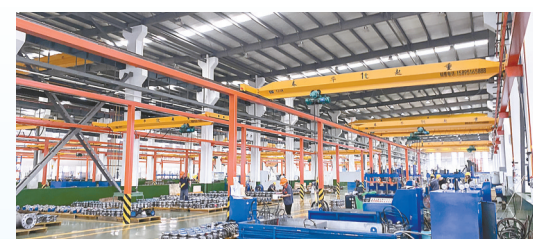
奥凯明通阀门项目: 该项目由上海奥凯明通实业有限公司投资建设,当期投资5亿元,年产阀门2万吨。