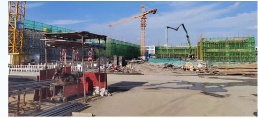
联东U谷·亭湖智能制造园项目: 该项目由北京联东投资(集团)有限公司投资建设,当期计划投资5亿元,打造智能制造产业园。