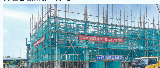
德比金刚线切割磨料悬浮液项目: 该项目由苏州德比光伏新材料科技有限公司投资建设,当期计划投资1.8亿元,年产金刚线切割磨料悬浮液3万吨。