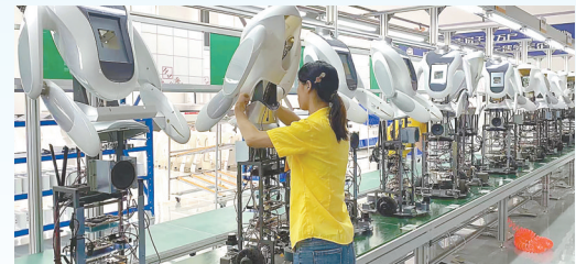
穿山甲机器人研发生产基地项目: 该项目由苏州穿山甲机器人股份有限公司投资建设,当期计划投资1亿元,年产扫地机器人2万台、商用机器人500台、无人车200台。