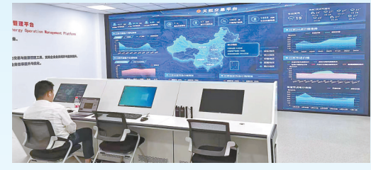
万帮数字能源(盐城)产业创新基地项目: 该项目由万帮数字能源股份有限公司投资建设,当期计划投资1亿元,建设星星能源总部、新能源数据平台。