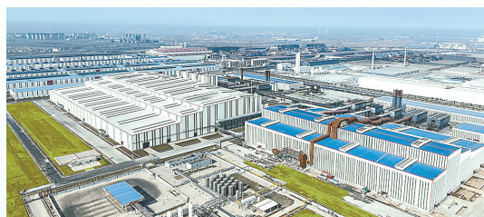
德龙不锈钢连铸板坯项目: 该项目由江苏德龙镍业有限公司投资建设,当期投资20亿元,年产不锈钢连铸板坯135万吨。