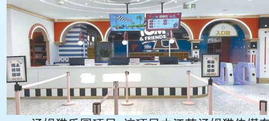
汤姆猫乐园项目: 该项目由江苏汤姆猫传媒有限公司投资建设,当期投资1亿元,建造集多媒体互动游戏区、亲子游戏区、益智触摸游戏屏区、充气城堡、沙池等游乐设施于一体的儿童游乐园。