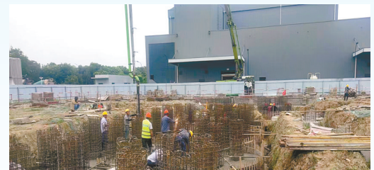
珩创磷酸锰锂电池正极材料项目: 该项目由江苏珩创纳米科技有限公司投资建设,当期计划投资5亿元,年产磷酸锰锂电池正极材料1万吨。