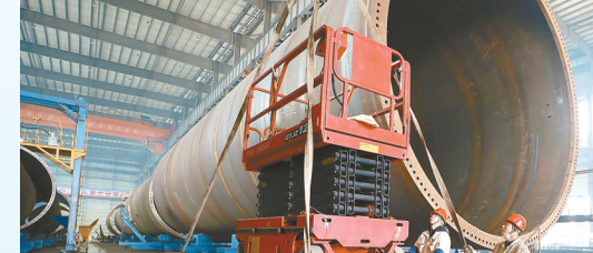
海恒海上风电装备项目: 该项目由江苏海力风电设备科技股份有限公司投资建设,当期投资5亿元,年产塔筒200台套,海上风机单桩基础、导管架基础承载平台150台。