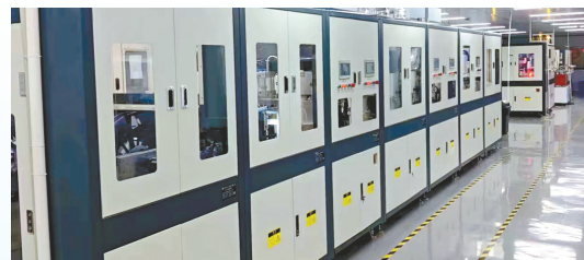
顺禾超声波雷达项目: 该项目由深圳市顺禾电器科技有限公司投资建设,当期投资1.2亿元,年产超声波雷达、摄像头模组约30万件。