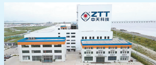
中天海缆系统项目: 该项目由中天科技海缆股份有限公司投资建设,当期投资3亿元,年产中高压海缆600千米。