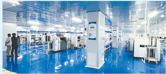
瀚赛电子项目: 该项目由汤姆泰克(TomTech)株式会社投资建设,当期投资3.2亿元,年产智能终端主板300万片、LCD液晶模组100万片、COB柔性灯带800万米、智能穿戴及体育用品终端产品300万件、智能体育用品外壳300万个。