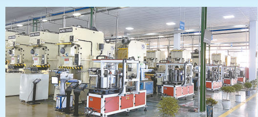
昶屹精密结构件项目: 该项目由昆山市杰尔电子科技有限公司投资建设,当期计划投资10亿元,年产新能源汽车金属结构件1000万件。