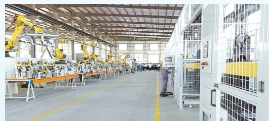
德恒柔性自动化项目: 该项目由广州德恒汽车装备科技有限公司投资建设,当期投资1.1亿元,年组装汽车整车装备生产线、柔性机械臂产线约400条。