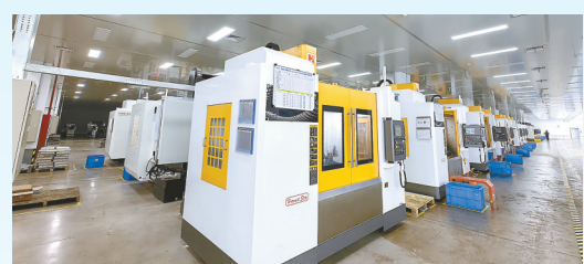
东创新能源结构件项目: 该项目由苏州市永创金属科技有限公司投资建设,当期计划投资10亿元,年产电芯端盖5亿片、新能源汽车零部件1000万件。