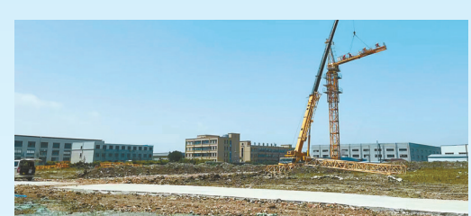
易新动力储能项目: 该项目由深圳易新能源科技有限公司投资建设,当期计划投资9.3亿元,年产动力储能电池系统集成1GWh、新能源材料隔膜5000万平方米、新能源智能设备3000台套。