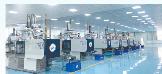
宇泰工业连接器项目: 该项目由北京宏宇泰科技有限公司投资建设,当期计划投资10亿元,年产工业连接器100亿只。