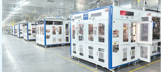
海博瑞12GW光伏组件项目: 该项目由无锡海博瑞光伏科技有限公司投资建设,当期投资25亿元,年产高效光伏组件12GW。