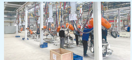
国新新能源汽车产线改造一期项目: 该项目由江苏悦达汽车集团有限公司投资建设,当期计划投资10亿元,年产新能源汽车7万辆。