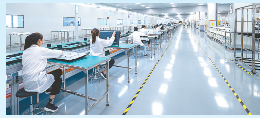
新辉开显示半导体项目: 该项目由新辉开科技(深圳)有限公司投资建设,当期计划投资53亿元,年产显示模组、液晶显示屏产品760万件。