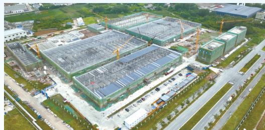
金盟纺织项目: 该项目由江苏金盟纺织科技有限公司投资建设,当期计划投资10亿元,年产丝光防缩巴素兰羊毛1.12万吨、碳化羊毛3800吨、毛条1万吨、精纺纱1800吨、高档面料500万米、特种服装10万套。