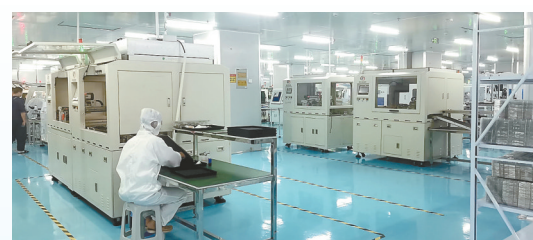
齐盛伟业光电显示模组项目: 该项目由深圳市齐盛伟业电子有限公司投资建设,当期投资10亿元,年产FTF彩色液晶显示模组36亿片。