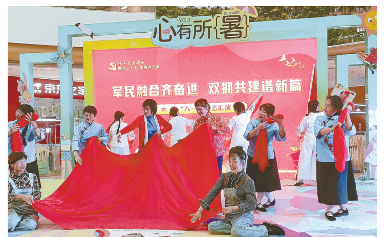
7月28日,东台市东台镇八林社区、玉带桥社区和公园社区联合吾悦广场举行“军民融合齐奋进 双拥共建谱新篇”文艺汇演活动,辖区退役军人、党员、社区文艺之星和居民群众等100余人共同庆祝中国人民解放军建军96周年。

夜巡夜查,照亮守护群众“平安路”。连日来,五汛镇综合执法局、31个村(居)干部、志愿者等多方力量组成夜巡查队伍,与派出所民辅警联动协作,深入辖区餐饮场所、宾馆等人员密集场所,重点对各场所内存在的治安隐患进行排查,消除各类治安隐患。“红色”夜学,不断提升群众幸福感。为不断满足群众高品质精神文化需求,该镇通过狠抓阵地建设、强化队伍建设、创新活动载体等举措,不断丰富和满足辖区群众的精神文化生活需求。依托各村新时代文明实践站、百姓大舞台等阵地,组织村民观看红色主题电影,不断厚植红色基因,传承红色基因。