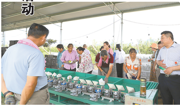
富安印刷包装机械展销培训中心 富民梨园生产基地

7月25日,东台市富安镇开展人大专题视察评议活动,先后视察评议了九九村整村供水管网改造提升、富安印刷包装机械展销培训中心、生命安全防护工程、富民梨园生产基地、富安镇小学易地搬迁、圩口闸启闭电动化改造项目。