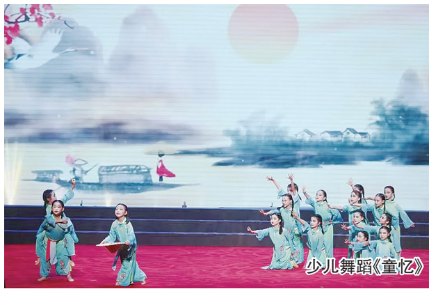
少儿舞蹈《只此青绿》