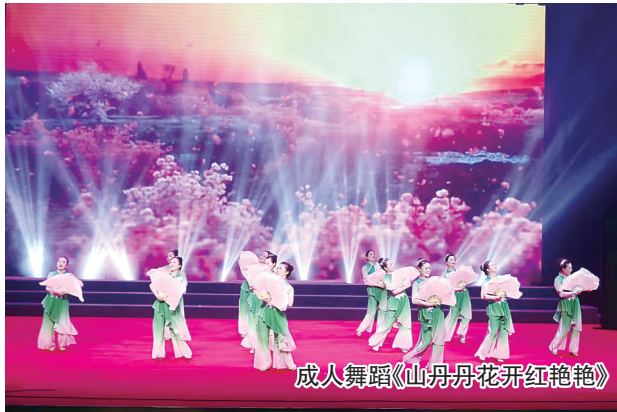
成人舞蹈《山丹丹花开红艳艳》

本次大赛描绘出水韵响水的人文之美、生态之美、和谐之美，深情讴歌了在中国共产党的领导下人民群众的美好幸福生活。“这次活动不仅充分展示了广大市民的舞蹈水平，也点燃了他们踊跃参与快乐健身的热情。下一步，我们将坚持以文惠民、以文化人、以文铸魂，用高品质文化供给与群众多元文化需求同频共振，不断丰富广大群众精神文化生活，传播文明新风、培育良好风尚，让更多的群众跳起来、舞起来、乐起来、美起来。”响水县文广旅局局长顾东海表示。