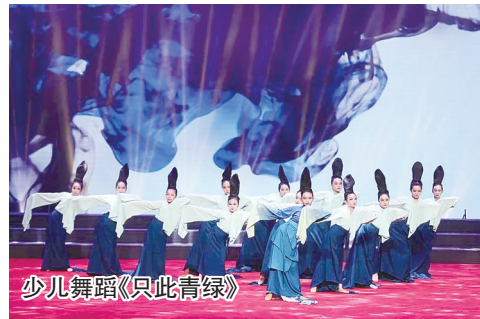
少儿舞蹈《只此青绿》