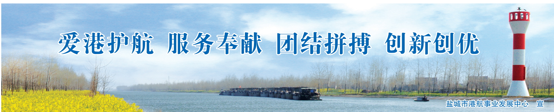
盐城市港航事业发展中心 宣