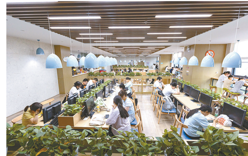
夏日炎炎，最是书香能解暑。市图书馆凉爽、静谧的阅读环境成为了众多市民“文化避暑”的目的，不少学生也选择在这里学习“充电”，享受充实而有意义的暑假生活。