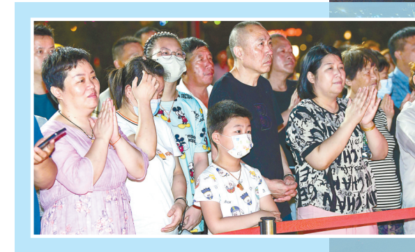
夜晚的盐城外滩城市阳台流光溢彩，市民徜徉河畔消暑纳凉。7月4日，“江风海韵”沿江沿海城市文艺联盟成立暨“盐·里精彩”优秀文旅融合作品展展演活动在盐城市成功举办，来自天津、内蒙古、上海、江苏、浙江、安徽、福建、山东、河南、湖北、湖南、重庆、四川、贵州、云南等15个省市的近百家文化馆，跨越江海、