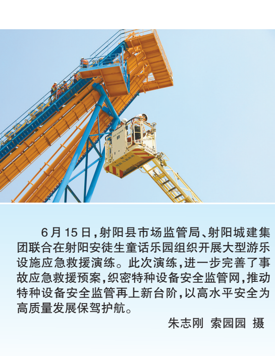
6月15日,射阳县市场监管局、射阳城建集团联合在射阳安徒生童游乐园组织开展大型游乐设施应急救援演练。此次演练,进一步完善了事故应急救援预案,织密特种设备安全监管网,推动特种设备安全监管再上新台阶,以高水平安全为高质量发展保驾护航。