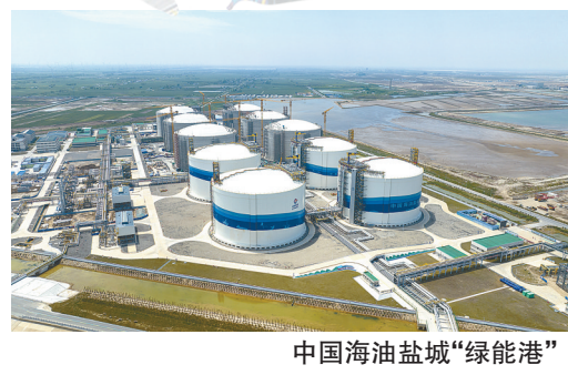
中国海油盐城“绿能港”

围绕产业链部署创新链,围绕创新链布局产业链,盐城抢抓数字化、网络化、智能化融合发展机遇,不断促进制造业高端化提升。连续开展“科技创新年”活动,2022年,新增高新技术企业239家,高新技术产业产值同比增长33.2%,创成2个国家级智能制造示范试点、15家省示范智能工厂、19家省五星级上云企业,均位居苏中苏北前列。