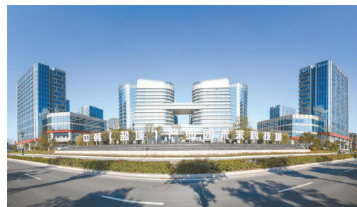
中韩(盐城)产业园未来科技城