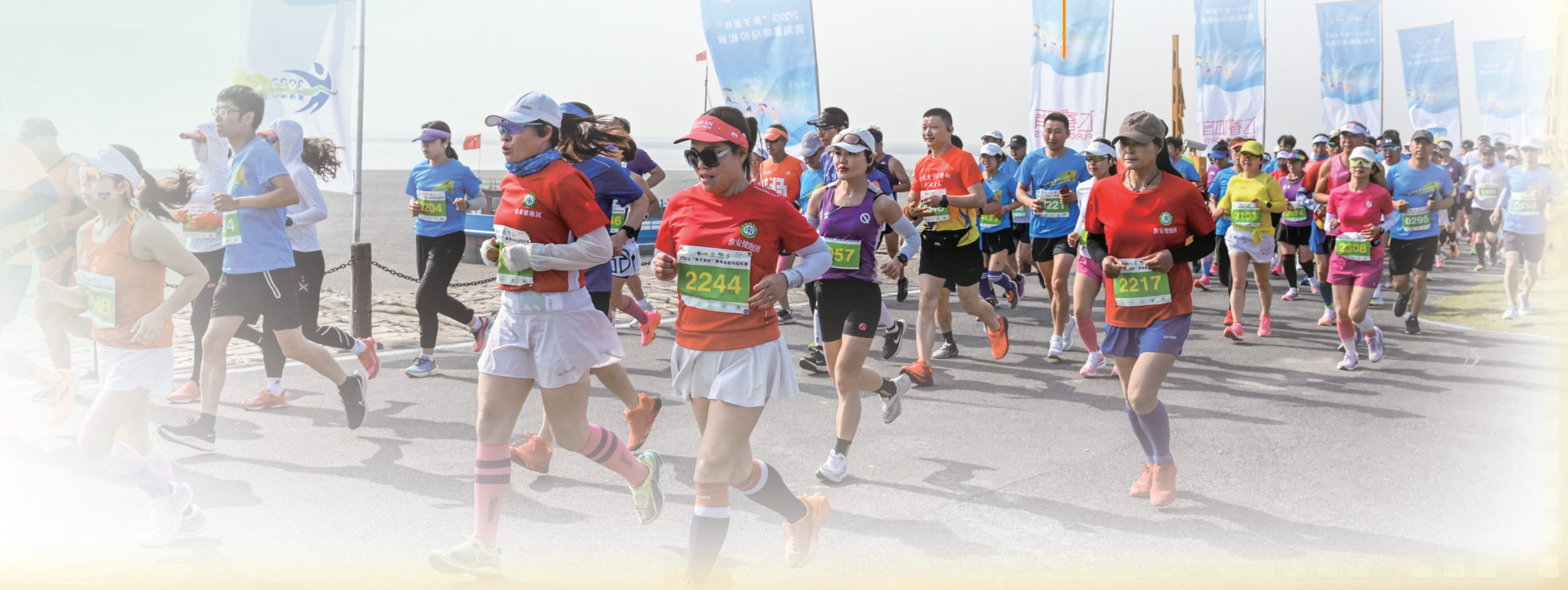
陆军 樊繁 单中华/文

站在新的历史起点,沿海经济区全面对标对党的二十精神,在生物多样性保护、康养经济、旅游经济和健康制造业方面不断赋予新的发展内涵,全区上下以追浪逐海的大气魄,跨越发展的大格局,扬帆破浪,奋楫笃行,全面推进中国式现代化沿海新实践,以高质量发展赋能中国式现代化沿海新画卷。