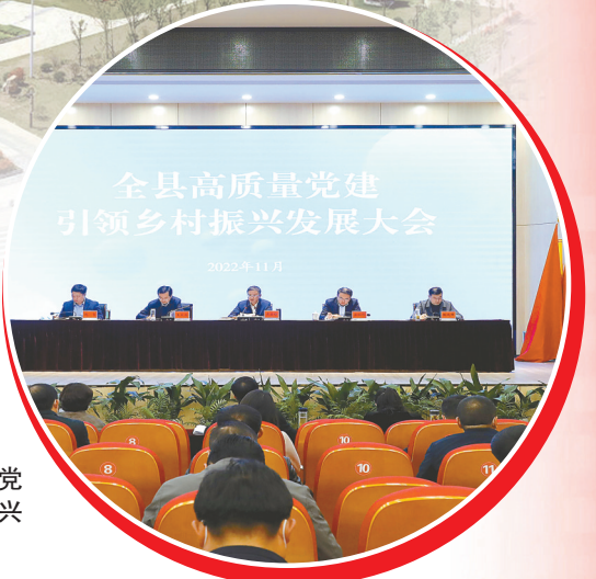
召开高质量党建引领乡村振兴发展大会

围绕新时代江苏基层党建“五聚焦五落实”三年行动计划和深化提升行动重点任务,坚持不懈抓基层、打基础、固根本,着力把党的组织优势转化为发展优势、治理优势。提升基层队伍战斗力。完成村“两委”集中换届任务,落实村书记“县乡共管”机制,成立县级村干部档案管理中心,推行村干部“三类五星”专业化管理。新选派驻村第一书记100名,选聘村级“乡村振兴顾问”1006名,成立农业产业链党委3个。深化村干部学历“三清零两提升”行动,1259名村干部参加学历提升工程。增强基层组织吸引力。集中改造提升党群服务中心153个,实现全县村(社区)党群服务中心建筑面积达标全覆盖。开展党群服务中心“加磁行动”,制定8大类42项村级服务事项清单,压茬打造乡村党群服务示范点5个,举办“家家到”现场观摩3次。组建“新新之火”党建联盟,成立“新火”先锋服务队,成立行业党委4个、新业态企业党组织22个,打造“海巢”暖心驿站14处。开展机关党建“六巡”工作,打造机关党建品牌21个、精品阵地5个。激发乡村振兴内生动力。召开高质量党建引领乡村振兴发展大会,制定“1+7”系列文件,启动村干部“创客”大赛,推动村集体牵头领办集体经营项目,组织“万企联万村、共走振兴路”活动,全县171个村参与联建项目115个。推动建设30个网红直播村,组织开展电商直播培训3期,相关做法在《中国组织人事报》刊载。