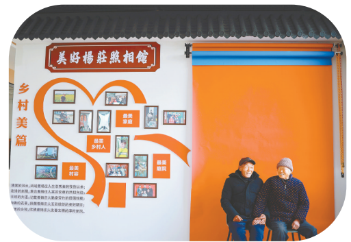
村党群服务中心免费为群众拍照