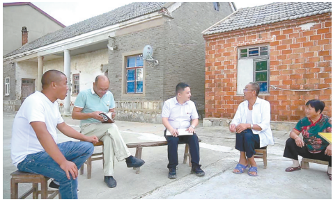
干部深入一线调研

实好中央和省、市委各项决策部署。高举伟大思想旗帜,坚持不懈抓好党的创新理论的学习贯彻,将其作为党员干部教育培训、“三会一课”、统一活动日的首要政治任务。健全完善“不忘初心、牢记使命”长效机制,扎实开展党史学习教育,组织开展“十个一百”庆祝建党100周年活动,牵头开展“两在两同”建新功行动,深入学习贯彻党的二十大精神,制作的《中国共产党组织工作条例》学习系列》微动漫入选全国党员教育优秀课件,获全省特等奖、全市特别奖。砥砺昂扬奋进力量。分类开展“专题大学习”“基层大轮训”“岗位大研讨”,举办各类培训班次60期,累计培训2万余人次。打造“红色文化教育、金色党建引领、蓝色经济发展、绿色生态示范”4条干部教育培训现场教学线路。持续深化“四比四争”活动,评选“奔牛奖”“蜗牛奖”6期、“滨海先锋”2期,全县干部队伍比学赶超、进位争先的氛围逐渐形成。