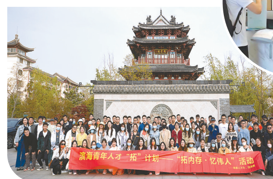
滨海青年人才“拓”计划活动