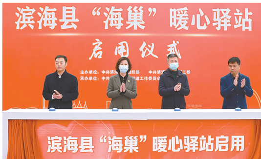
开展海巢暖心活动