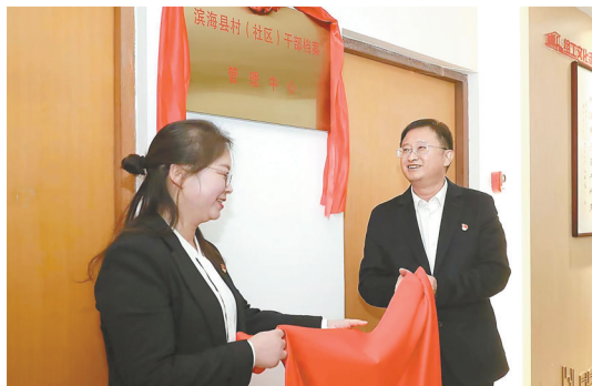
成立村干部档案管理中心

围绕打造高素质专业化干部队伍要求,对标新时代好干部标准,不断深化“选育管用”全链条机制,激励干部担当作为。鲜明选人用人正确导向,坚持“为发展配干部、凭能力用干部、以实绩论英雄”,制定在一线考察识别干部实施办法,推动干部资源向招商引资、征地搬迁等“五个一线”集聚,三年来先后13次充实加强和调整优化干部队伍,提拔重用的科级干部中基层一线占比64.7%,干部队伍结构更加优化。抓好后继有人根本大计,大力实施优秀年轻干部培养选拔“后浪计划”和“8090”培养计划,动态建立优秀年轻干部蓄水池,健全常态化关怀、磨炼机制,选派125名年轻干部到村居企业、招商引资、征地搬迁等一线摔打磨炼,13名年轻干部到先进地区挂职锻炼。坚持关口前移厚爱,加强干部全方位管理和经常性监督,常态化开展选人用人专项检查,健全完善诬告陷害查处和容错纠错机制,推出“三项机制”典型案例58个。强化公务员队伍管理,开展“争先创优”专项职级晋升,在全市率先实行县级优秀公务员健康体检制度,积极营造崇尚先进、关怀关爱干事创业氛围。