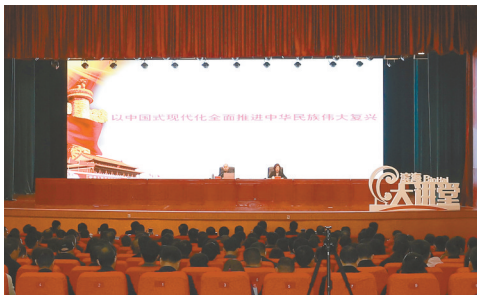
滨海大讲堂邀请中央党校教授现场授课

牢牢掌握组织工作正确方向,坚持以政治建设为统领,以思想建设为基础,在服务中心大局中坚决扛起组织部门的使命担当。筑牢政治信仰基石,引导全县党员干部深刻感悟“两个确立”的决定性意义,更加坚定地忠诚核心、信赖核心、紧跟核心、维护核心,不断增强“四个意识”、坚定“四个自信”、做到“两个维护”,以对党绝对忠诚的政治自觉坚决贯彻落实