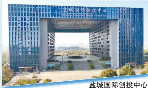
盐城国际创投中心

“人才是城南开投公司的第一资源!”深化人才体制机制改革,是窥探该公司改革的又一个生动镜头。近两年公司引进南京大学、南开大学、复旦大学等名校优生14名,分派到下属专业化公司,补充新鲜血液。此外,公司通过加强内部管理,推进规范运行,启动人事、薪酬、考核三项制度改革,完善人事管理办法、薪酬计发办法,全面推进用工市场化,为公司长远发展储备人才。