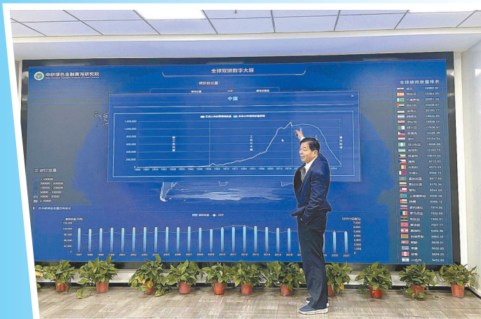
智慧大屏显示各国“双碳”数据