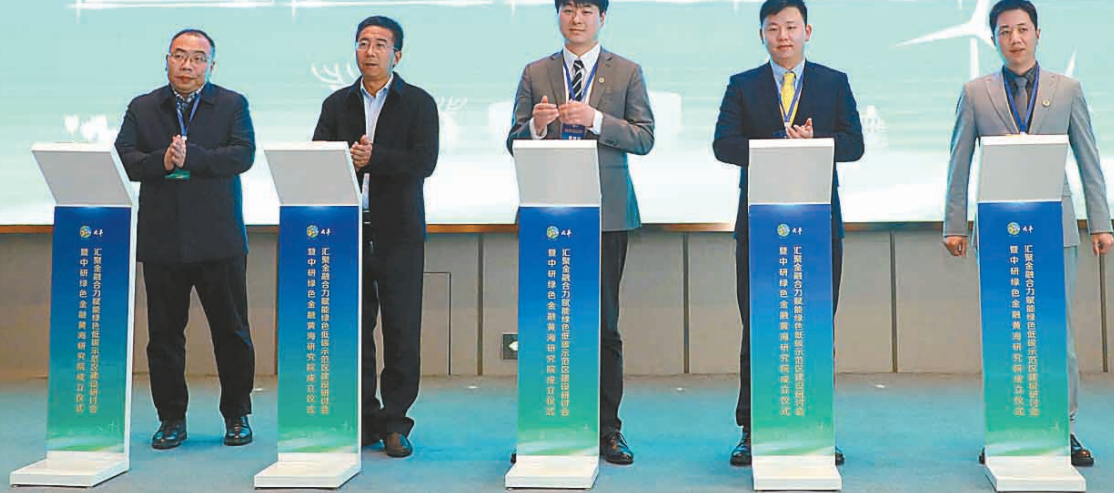
搭建“政金企研”对接平台