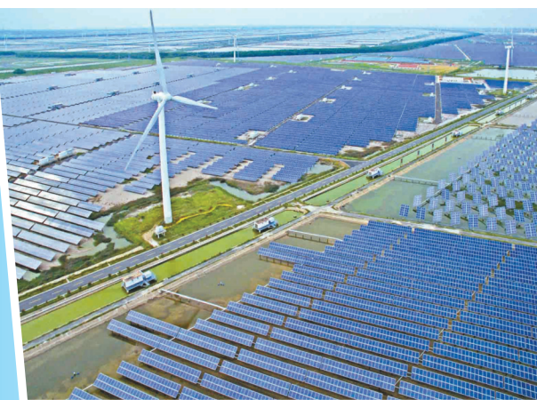
“绿金”动能赋能绿色产业发展

产品创新为绿色金融发展带来活力,也形成了我市绿色金融的一大特色。2022年以来,在市地方金融监管部门的指导下,全市金融机构创新活力持续迸发,频频创出“首单”“首笔”“首个”:全国首单“湿地修复蓝色碳汇远期质押贷款”、全省首笔“新能源产业基金”、盐城地区首个“绿色支行”……这些有益实践为我市绿色低碳发展增加了有效金融供给,注入了强劲的“绿金”动能。