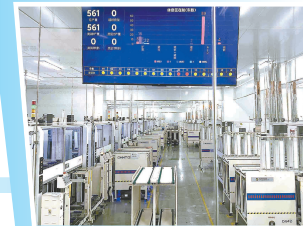
金融支持绿色企业