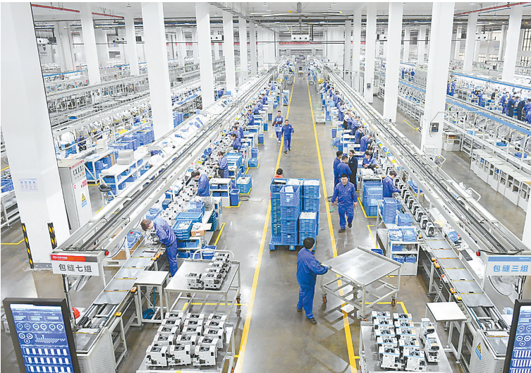
3月23日,在位于浙江省台州市的杰克科技股份有限公司,工作人员在装配车间装配缝绉机。