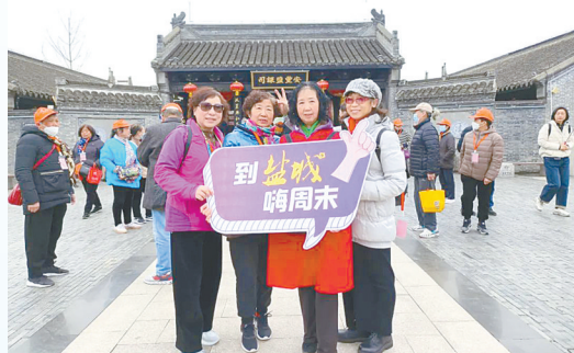
外地游客盐城嗨周末