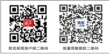
我盐新闻客户端二维码