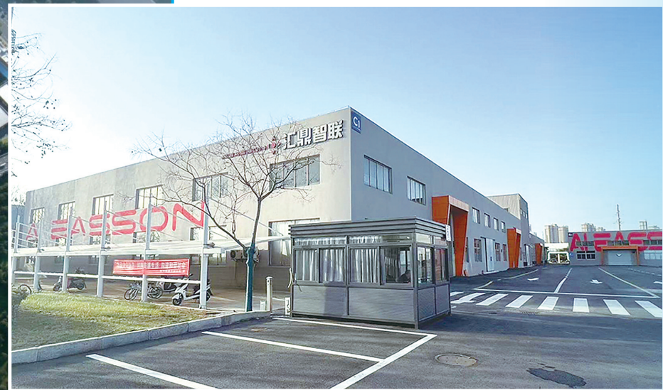
汇鼎智联装备科技(江苏)有限公司